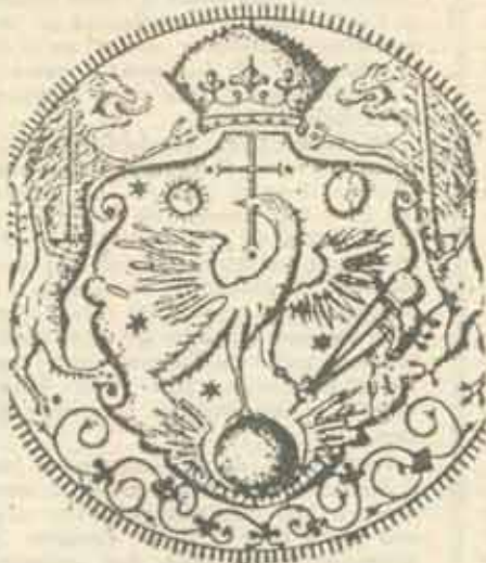
Stema din sigiliul lui Mihnea Turcitul (1587)