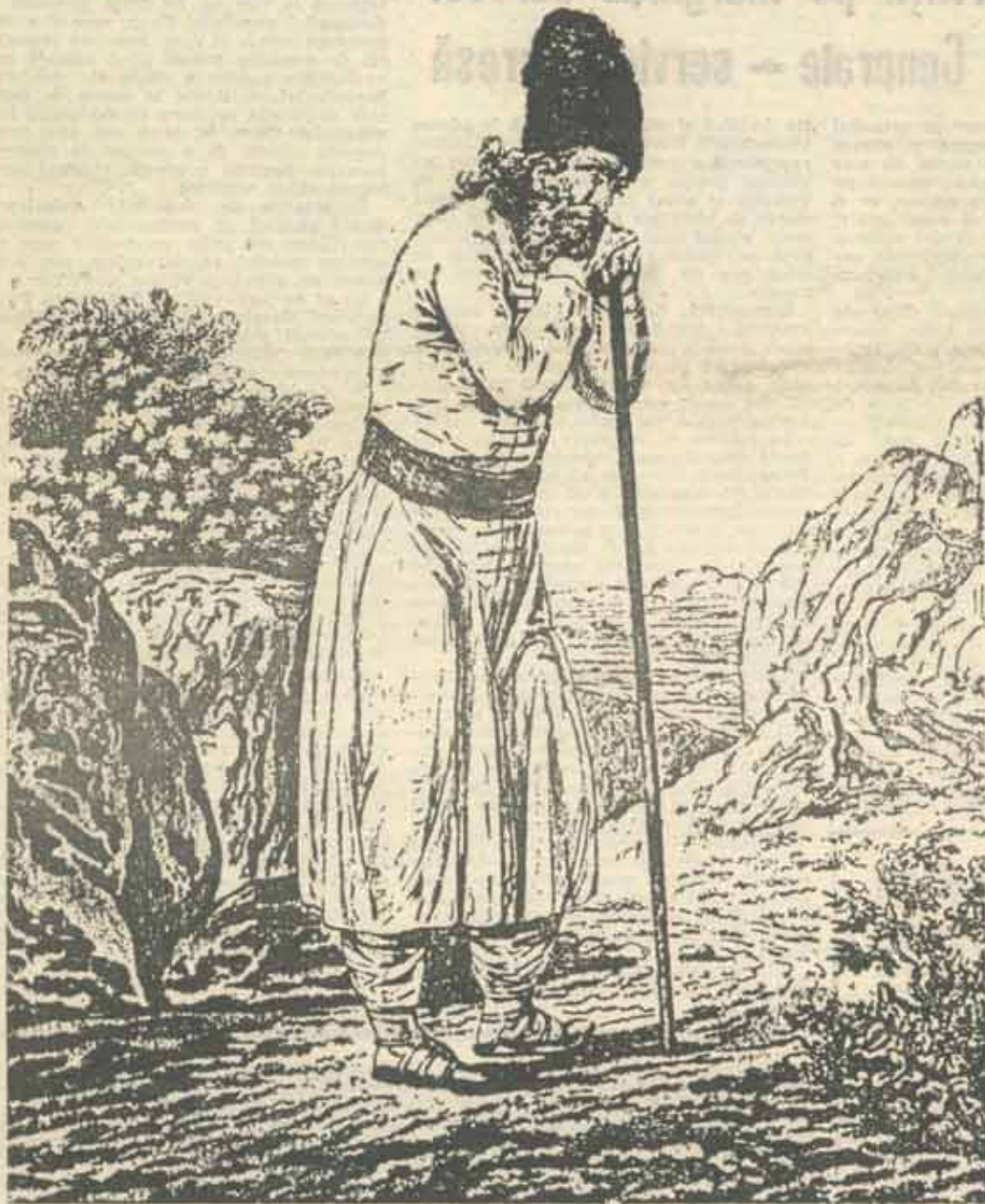
Țăran bucovinean. Desen de ELLIS WILLIAM (din „Costume populare din țările Europei de Răsărit”)

„De ce nu putem încă înțelege că singurul reazem al actelor noastre și al moravurilor noastre este responsabilitatea? Responsabilitatea față de ceva mai presus de familia mea, țara mea, întreprinderea mea, succesul meu, responsabilitatea față de o ordine a existenței în care orice faptă a noastră se înscrie pe veci și e judecată drept. Mijlocitorul dintre noi și această autoritate superioară se cheamă tradițional conștiința omenească”.