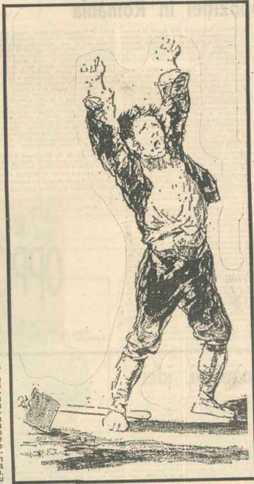
„Tu n'arriveras à rien en criant”