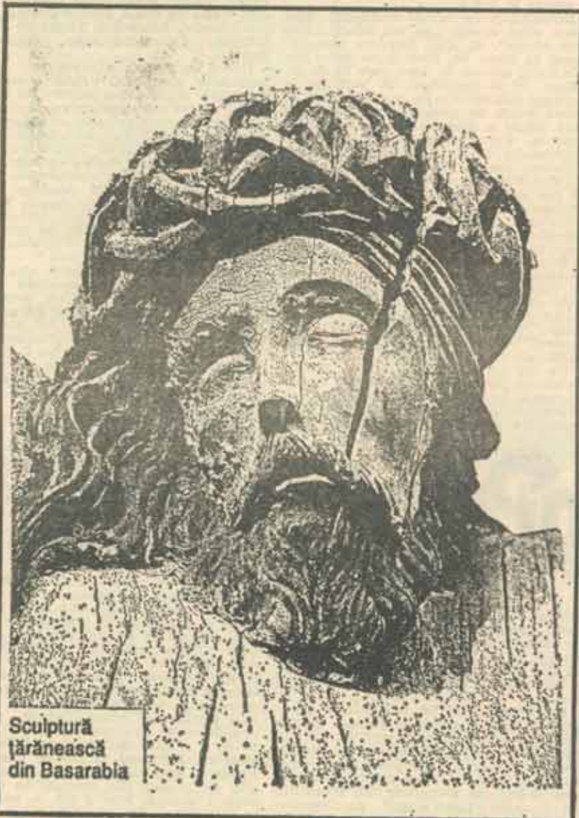
Sculptură țărănească din Basarabia

Versiune românească de ILEANA CANTUNIARI