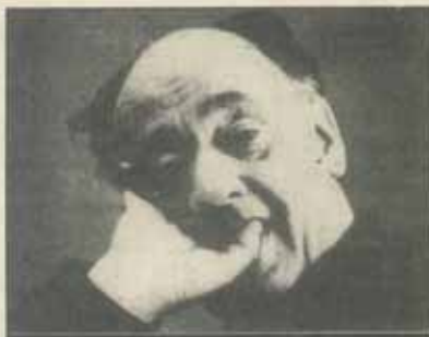
Luni 28 martie, la Paris, Eugen Ionescu a încetat din viață

"Sufăr aici - zice Raicu - de un fel de obsesală neîncetătoare, din care aș vrea să ies, din care nu pot să ies oricît aș vrea." Pe acolo, cartea se resimte de această stare. Comentatorul privește nu o dată îndărăt cu dezolare la rozele eforturilor sale: "Ar trebui, dacă aș fi loial cu mine însumi, să întreprind aceste considerații...". "Nu se poate scrie critică literară - decît întorcîndu-te cu spatele la moarte,