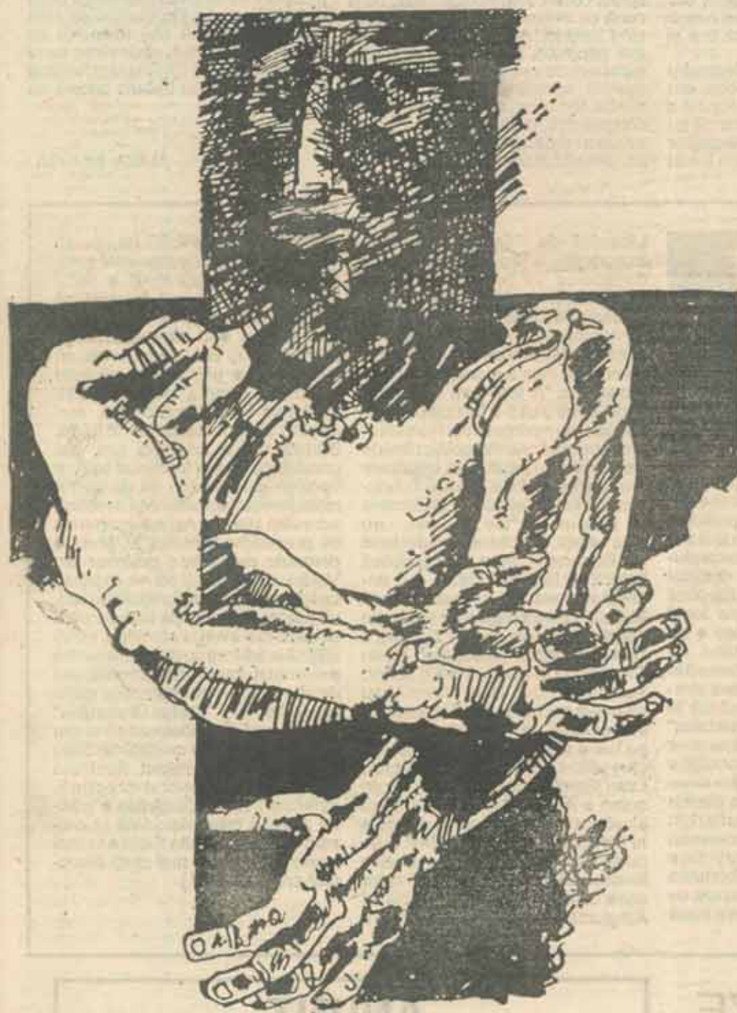
• Ilustrăm acest număr cu lucrări de POHRIB

Nu mai faceți politică, băieți, pină ce nu veți cunoaște istoria, dacă nu a lumii încă, a patriei noastre și drepturile ei istorice.