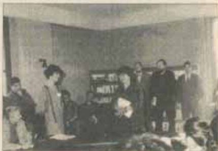
Irena Lasota (centru) la deschiderea Școlii

Adepților teoriei Malta (Occidental = SUA a dăruit iar România imperiului rusesc) și comentatorilor politici deziluzionați de prestația politicianilor momentului ("dacă ar scoate acum un tânăr, niște tineri", suspină ei săptămînal) le-a oferit o replică Centrul pentru Pluralism (directoare Luminița Petrescu). Vineri 25 martie 1994, în spațiile Editorii Humanitas, a avut loc deschiderea oficială a Școlii Tinerilor Lideri Politici (ȘTLP), finanțată de Institutul pentru Democrație în Europa de Est (IDEE). Printre personalitățile invitate cu această ocazie s-au aflat: Irena Lasota, președinta IDEE, Mark Askino, atașatul cultural al Ambasadei SUA, Jeffrey Jamison, atașatul cultural adjunct, numeroși reprezentanți ai presei. Cu această ocazie, Călin Anastasiu, Stelian Tănase și Dan Pavel au lansat revista "Polis".