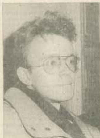
Se află America pe o pantă civică descendentă?

Călătorii europeni ajunși pe pământul Americii au fost dintotdeauna impresionați de numărul extrem de mare al asociațiilor civice voluntare, care constituie nucleul societății civile americane. În urmă cu mai bine de un secol și jumătate, Tocqueville remarcase faptul că americanii de toate vârstele și condițiile sociale formează în mod constant asociații de diverse tipuri în vederea promovării intereselor lor comune și a îmbunătățirii vieții lor cotidiene. În ochii călătorului francez, această propensiune de a forma organizații civice reprezenta cheia succesului democrației în America, o observație la fel de valabilă și astăzi, la sfârșitul secolului XX.