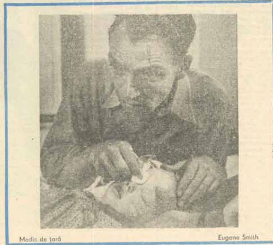
Medic de țară

Au consemnat: ANDREI CORNEA DAN PAVEL RODICA PALADE