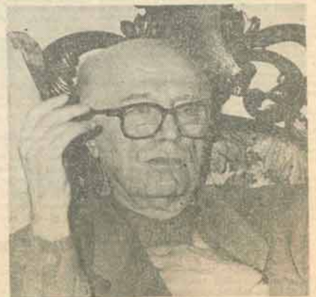
● Virgil Ierunca