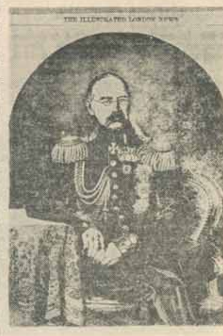
Prințul Gorceakov, comandantul armatei ruse în războiul Crimeii (1855)

avut, cum și cu ce au fost dotate tehnic, cine le-a comandat de sus și pînă jos, unde erau cazate, și din ce categorii de oameni au fost compuse? Într-o opinie, nu chiar singulară se susține că nu este vorba de soldați de rînd, ci de elemente cu înșurări și „calități” mai puțin obișnuite. La întrebarea firească unde sînt, răspunsul ar putea fi exact și dacă ne-am referi la numărul, deloc mic, al celor ce, după încetarea focului, într-un interval de timp oarecare au părăsit țara, trecînd granița fraudulos sau — apoi — chiar cu pasaport, în Iugoslavia și Ungaria. Este de sperat că cercetările penale ce se fac și a căror durată nu este deloc previzibilă vor scoate la lumină adevărul pentru noi și pentru istorie. Închei cu două precizări: 1. — securitatea, în fapt a avut cel mai mare rang, cu excepția stăpînului suprem — în ierarhia societății noastre — atît pe linie de partid cît și pe linie de stat, iar partidul n-a fost decît un mișc, sau mai clar spus, o gogoașă; 2. — securitatea nu a fost desființată ci numai transferată, fără alte „Directii” în subordinea Ministerului Apărării Naționale care a păstrat, fără să ni se spună, ceea ce a considerat actuala conducere a țării că trebuie menținut.