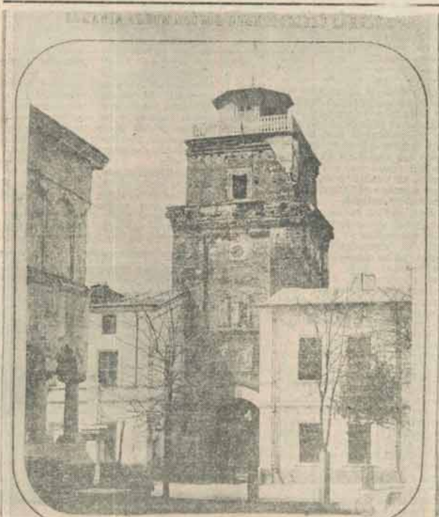
Turnul Colței (1367)