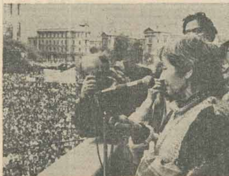
Dolina Cornea, în balconul Universității bucureștene