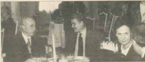
Shimon Peres, Teodor Melescanu și Catherine Lalumière

s-a aflat în sudul Transilvaniei, leagătura formării poporului român, al culturii și civilizației sale. Au urmat secole de năvăliri ale unor popoare migratoare venite din estul continentului și din Asia, care, în drumul lor spre Europa, au străbătut teritoriul acestei țări, locuitorii fiind nevoiți să-și refacă de fiecare dată gospodăriile distruse și jefuite. Prin sacrificiul său impus, poporul român a salvat, timp de secole, ceea ce popoarele din vestul continentului clădeau și acumulau pe plan material și spiritual, și această istorie a poporului român s-a repetat pînă aproape de zilele noastre. (...)