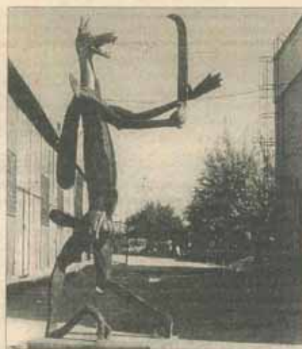
Neculai Păduraru: „Clicus Dacicus” (1991)

Surprizele pozitive ale acestui Salon nu se opresc însă aici. Lucrări remarcabile expun Ștefan Căliția („Rul roșu”, 1995, o pinză imensă, al cărei