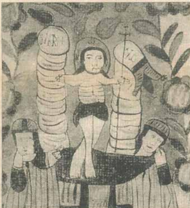
Învierea – icoană de la Nicula, sfîrșitul secolului XIX

Am analizat anul trecut importanța sărbătorii Paștelui pentru creștinism, sensul profund al morții și Învierii Fiului lui Dumnezeu pentru mîntuirea neamului omenesc, aspectul ontologic al Răscumpărării (completîndu-l pe cel juridic și sacrificial), precum și sensul schimbat al morții înșiși, operat de actul Învierii. Încheiem, insistînd asupra universalității mîntuirii și a restaurării întregii firi cosmice în plenitudinea primordiale. Trebuie spus că devoția de tip popular a surdina în mișcătoare ritualuri adiacente (dar, totodată, convergente și solidare cu scenariul sacru) sensul re-cosmicizator, atoterestaurator al jertfei răscumpărătoare a Fiului.