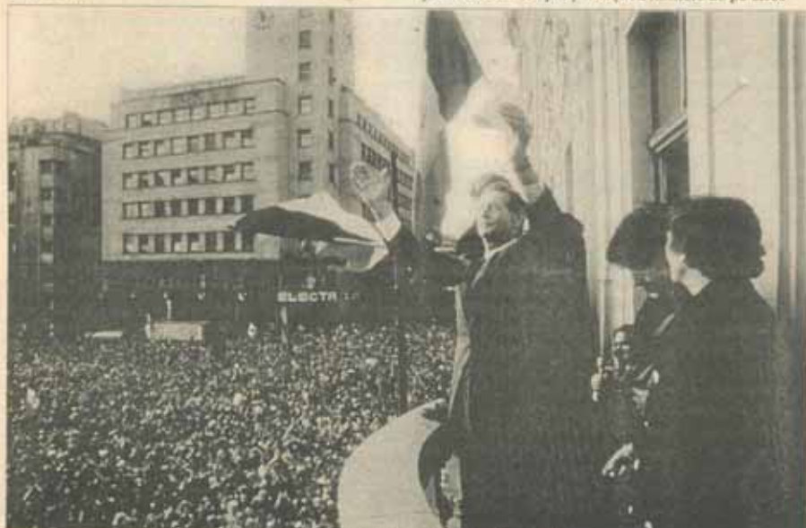
1992: Regele Mihai de Paști la București