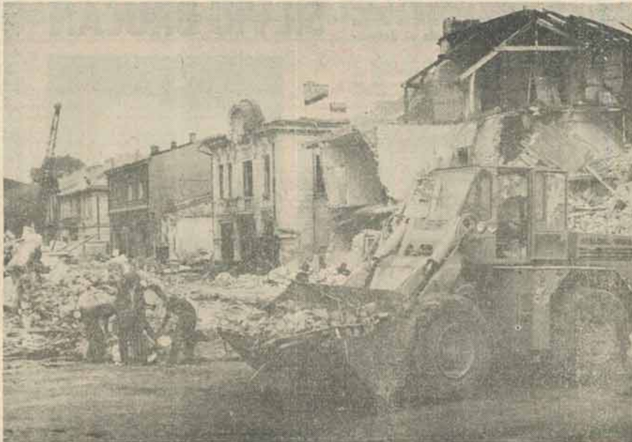
Imagine din timpul demolării - 1982

Cei care au răspuns chestionarelor noastre se clasează în două mari categorii de rezidenți urbani: specialiști în domeniul proiectării de arhitectură și urbanismului și bucureșteni cu alte profesii. Subliniem că a fost studiat