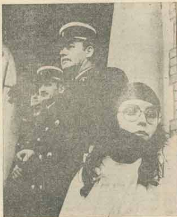
Paris, Universitate, 1968