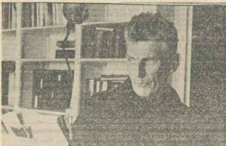
Samuel Beckett, 1968