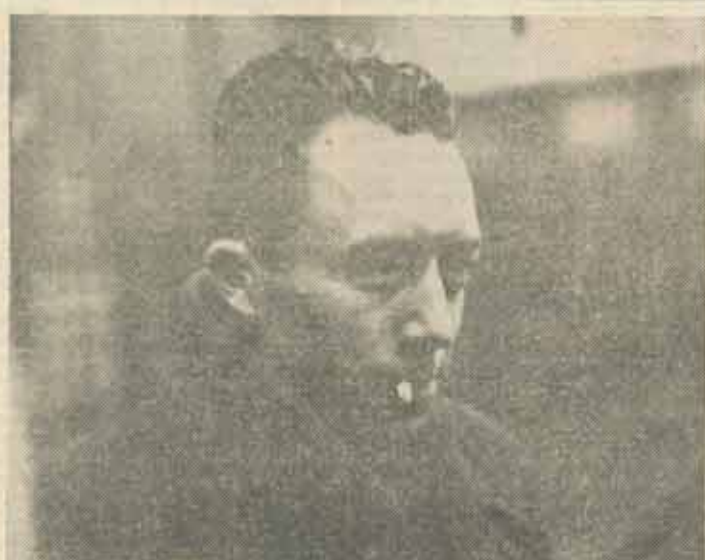
Albert Camus, 1968