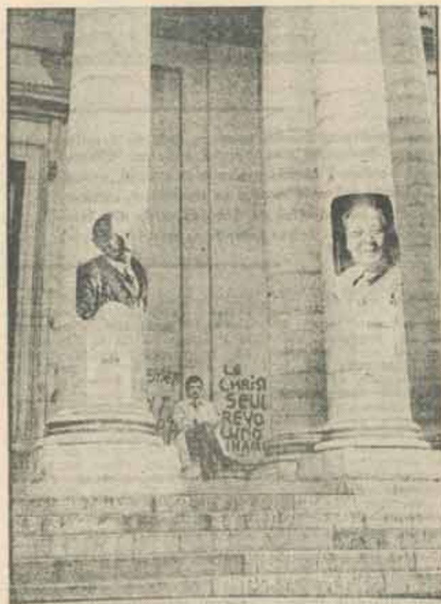
Paris, Universitate, 1968