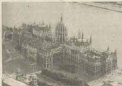
Budapesta - clădirea Parlamentului

Deși sondajele de opinie care au precedat primele alegeri libere din Ungaria postcomunistă nu au indicat o victorie decisivă pentru FDU, acesta a devenit câștigătorul detașat al alegerilor din aprilie 1990.