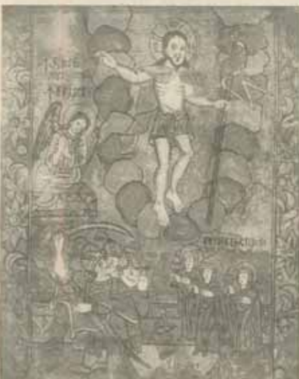
"Învierrea", Arpașul de Sas, Savu Moga, 1864 (reproducere din albumul "Pictura păunească pe sticlă", ed. Meridian, 1979)

"Nu stă în puterea istoricului nici să stabilească acest fapt, nici să-l infirme realitatea: afirmarea, ca și negarea lui depășesc planul istoric...". "Istoricul poate și are datoria să noteze doar atît că s-a petrecut ceva fără de care întreaga dezvoltare ulterioară a creștinismului devine efectiv de neconcepțut." (Marcel Simon, Primii creștini , trad. rom. de Octavian Cheștan, ed. Polimark, București 1993, pp. 27 și 28.) Ca aproape întotdeauna atunci cînd explicarea istorică taie, primul plan al reflexiei îl ocupă teologia. Potrivit Bibliei, prin căderea primilor oameni, legătura ontologică cu divinul s-a desfiat și astfel a început coruperea firii și moartea a pîtruns în lume. A fost nevoie de o nouă trupere a "dumnezeirii" în lume pentru ca această legătură să fie restabilită; actul prin care Dumnezeu a restabilit starea de comuniune cu El însuși este, potrivit creștinilor, întruparea, adică viața, moartea și învierrea lui Iisus Hristos, care nu avut loc în istorie: "în timpul lui Pilat din Pont". Dacă Răscum-părarea este socotită de creștinii cel mai minunat act dumnezeiesc (asemănător Creației) în legătură