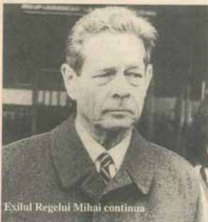
Exilul Regelui Mihai continuu

Ministrul Apărării Naționale, Gheorghe Tinca, a depus la sediul NATO din Bruxelles documentul de prezentare a României la Parteneriatul pentru pace. Acesta este în fapt o ofertă care conține o parte politică și o parte militară. Documentul are menirea de a contribui la stabilitatea zonală, cu perspectiva obținerii unor garanții de securitate.