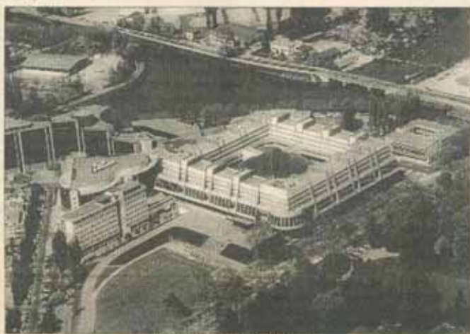
Strasbourg, Palatul Europei

ea nu va fi respinsă, dar Comitetul de Miniștri (organism de regulă mai conservator în comparație cu Adunarea Parlamentară) va opta pentru Convenția-cadru. România intrase însă în CE la sfârșitul lui septembrie 1993, angajându-se să respecte documentele elaborate, și Recomandarea 1.201 este citată într-o scrisoare a ministrului de Externe Teodor Meleșcanu, adresată Consiliului Europei. Susținătorii români ai Recomandării 1.201 (PL '93, parte din PD, parte din GDS etc.), atrăgeau atenția asupra faptului că respectarea sa făcuse obiectul angajamentului ferm al României la intrarea în CE. Cei care nu o conside-