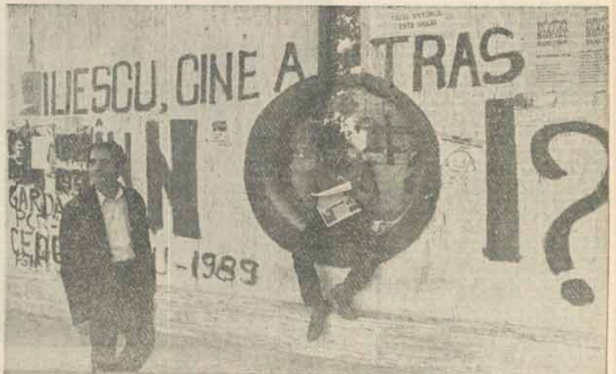
„Ar fi neînțelept să vedem triste moștenire a ultimilor patruzeci de ani ca 'ceva străin de noi' (VACLAV HAVEL, interviu în Financial Times, 19.03.1990)