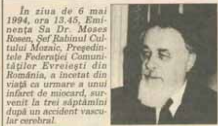
În ziua de 6 mai 1994, ora 13.45, Eminentia Sa Dr. Moses Rosen, Șef Rabinalul Culturii Mosaic, Președintele Federației Comunităților Evreiești din România, a încetat din viață ca urmare a unui infarct de miocard, survenit la trei săptămîni după un accident vascular cerebral.