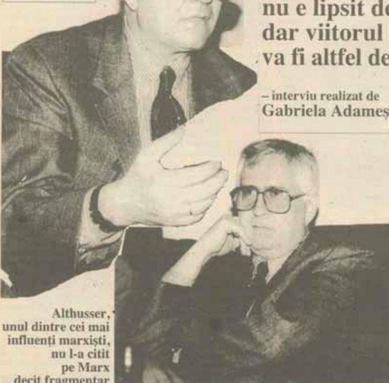
Althusser, unul dintre cei mai influenți marxști, nu l-a citit pe Marx decât fragmentar

Marxismul pare să nu mai aibă viitor în Europa de Est, nici în România. Dar în Occident?