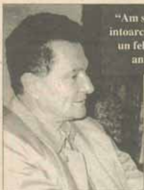
"Am senzația unei întoarceri în timp, la un fel de critică a anilor '50."

compromisă într-un fel sau altul, nu trebuia să mai existe nici un om curat, în care alții să poată să creadă, sau care să-și poată menține o poziție demnă în viața de toate zilele. Da, măreț! Idee, colosală, genială! Fiecare