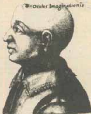
Robert Fludd, Arx memoriae (1619)

în fața ochilor toată întinderea problemei pe care o are de soluționat Culiănu. Într-adevăr, dacă tipul exemplar al Renașterii nu este, cum se crede, Erasmus, adică raționalismul scolastic travestit în hainele raționalismului filologic, ci Marsilio Ficino, clericul care a făcut un superb elogiu erosului și magiei erotice, atunci chestiunea este de fapt aceasta: ce a putut elimina bruse de pe scena istoriei tipul uman al Renașterii, înlocuindu-l în numai două secole cu tipul rațional-laic, cel care, în golul lăsat de plecarea lui Dumnezeu, a inventat știința modernă?