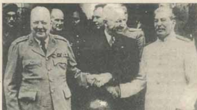
Conferința de la Potsdam. Winston Churchill, Harry S. Truman și I.V. Stalin

Pregătirile de comemorare a 50 de ani de la sfârșitul celui de-al doilea război mondial domină nu numai mediile de informare, ci și declarațiile publice ale oamenilor politici din Germania. Polemicile și controversele legate de semnificația zilei de 8 mai 1945 și-au găsit ecoul și în numeroasele declarații date publicității de partide, organizații și instituții democratice. Încercările de bagatelizare sau relativizare a zilei de 8 mai sînt respinse cu vehemență atât de partidele coaliției guvernamentale – Uniunea Creștin-Democrată/Uniunea Creștin-Socială (CDU/CSU) și Partidul Liber Democrat (FDP) –, cit și de partidele din opoziție – Partidul Social-Democrat (SPD) și Partidul Ecologist. Toate aceste partide sînt de părere că la 8 mai 1945 Germania a fost eliberată de dictatura nazistă. Cu prilejul unor ceremonii comemorative, o seamă de politicieni au criticat forțele și grupările conservatoare de dreapta care vorbesc în mod unilateral despre „ziua înfrîngerii”, punînd accentul pe efectele produse de sfârșitul războiului, adică pe îgonirea a milioane de germani din țările răsăritene, pe împărțirea Germaniei în două state și pe începutul dictaturii comuniste în partea de est a țării. Cauza pentru dezastrul produs a fost regimul dictatorial hitlerist. A ignora cauzele și a vorbi numai despre efecte se consideră de către personalități democratice ca o jignire adusă victimelor. Este vorba despre acele persoane care s-au ridicat împotriva nazismului, opunînd-