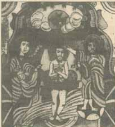
"Botezul Domnului" - Icoană pe sticlă de la Nicola.

Aproape peste tot există credința că, în noaptea dinaintea Bobotezei, exact în miezul nopții, se deschid cerurile și omul îl poate zări pe Dumnezeu. Tot atunci se poate auzi toaca din cer. Cine aude toaca din cer - este motivul pentru care mulți obișnuiau la țară să privegheze - sau îl zărește pe Creator, îl poate cere Acestuia orice și va avea parte de noroc, belug și sănătate. În Bucovina se crede că în noaptea Bobotezei, cînd corul "este deschis", "Dumnezeu cu toți îngerii și toți sfîșii se uită asupra făpturii omului pe pămînt". În momentul aflării crucii în apă, toate se sfîșiesc, toate apele "se botează" (prin simpatie, n.n.), chiar și cele din virful muntelui, și toți dracii ies din apă ca să nu fie botezați. În unele locuri se crede că în noaptea de Bobotează, lupii stau la pîndă pe gheață, la