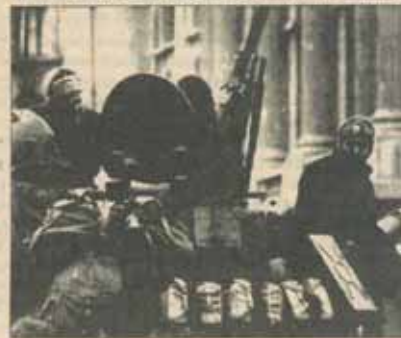
"Soldații, nu trageți în părinții și frații voștri!" - lozincă din 21 decembrie '89

TAB-urile au început să ambaleze și amenințau că or să treacă peste noi; să facem bine să golim piața, ajunge circul, gata. Cînd auzeam motoarele TAB-urilor, ne puneam jos, pe asfalt - mulți pleaseră, vîzînd că se-ngroașă gîmna. Un grup de bătăuși a intrat în mulțime, a ciomănit cițiva, și la un moment dat, cînd TAB-urile reambalau, soldații