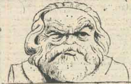
• CARICATURA DIN „SPECTATOR”

Îmbălsămat în mausoleurile stalinismului nu este inșăși Marx, ci epigoni care l-au redus ca să încapă în strîmța lor mediocritate. „Marx este mort în Lenin, în Stalin, în toate patosurile întreprinse pentru a-l confisca în univoc, în intolerant, în fanatic și care au obliterat cu orbirea și partizanatul lor, ezitarea textului lui Marx, cercetarea incoactivă a unei teorii critice” (Jean-Marie Benoist, Marx est mort, Paris, 1970, p.250), dar „împotriva lor, cîrmă dreptul de a-ți fi pe Marx ca pe Parmenide, pe Platon, pe Descartes, pe Leibniz, pe Kant, pe Hegel...” (ibid., p. 251).