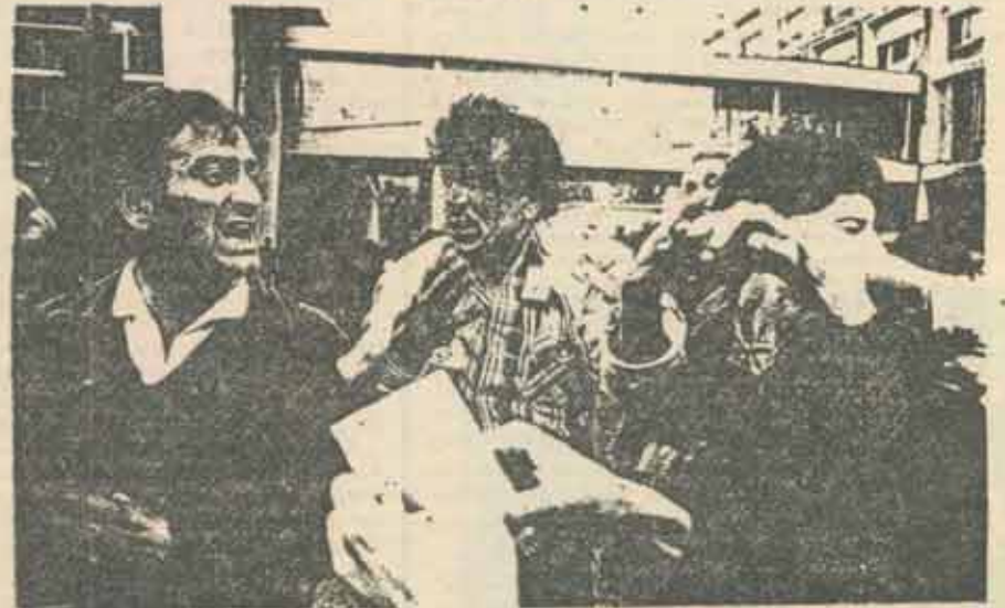
● Fotografiiile din acest număr provin din fototeca revistei și videoteca Grupului audio-visual al G.D.S.