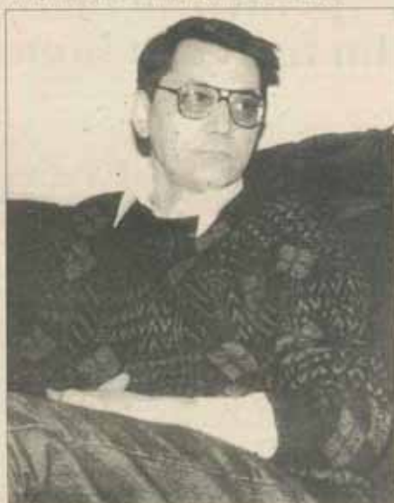
43 ani. Președintele Consiliului de administrație al Fundației Soros pentru o Societate Deschisă și directorul Institutului de Marketing și Sondaje (înființat în 1991).

În '93 am schimbat procedura de decizie. Acum sînt 17 comisii și 45 de jurii. Comisia este un organism care are un buget, în care eu nu votez. La comisii se primesc cereri și se decide cui să se dea banii. Juriul primește cereri pentru un anumit tip de activitate, de exemplu burse la Universitatea Pennsylvania, și decide care din cei 400 de candidați ocupă cele 5 locuri puse la concurs. Juriul nu are un buget, are numai niște locuri pe care le ocupă, asta e diferența. Activitatea decizională a Fundației e îndeplinită de Consiliul național al Fundației.