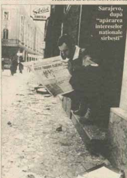
Sarajevo, după "apărarea intereselor naționale sîrbești"