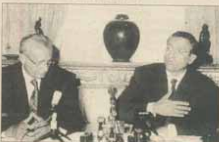
Ministrul Apărării francez, François Léotard și Ministrul Apărării român Gheorghe Tîncă

● François Léotard a sosit în România François Léotard, ministrul Apărării din Franța, a sosit în România. În cadrul unei ceremonii organizate de Universitatea București, i s-a decernat titlul de "Doctor Honoris Causa".