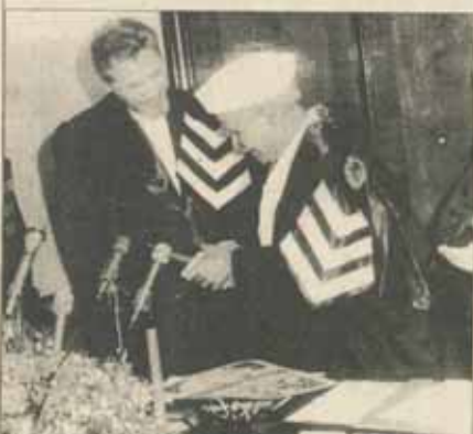
Rectorul Universității București, Emil Constantinescu, acordînd titlul de Doctor Honoris Causa înaltului oaspete

S-a născut la data de 19 august 1918, în Bhopal. Licențiat în literatura engleză, hindusă și sanscrită. Doctor în drept (Honoris Causa) al Vikram University; doctor în științe sociale (Honoris Causa) al University of Mauritius (Port Louis); doctor în literatură (Honoris Causa) al Meerut University.