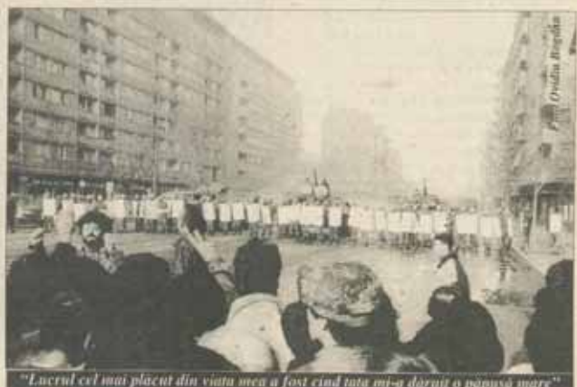
"Lucrul cel mai plăcut din viața mea a fost cînd tata mi-a dăruit o păpușă mare"

65% din opinii arată că după o mare moarte, nu mai poți fi subiectul unor lucruri plăcute.