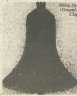
Mihai Sărbulescu, (Grupul Prolog) Clapot