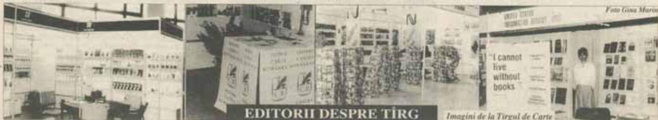
Imagini de la Tîrgul de Carte

Tot cu prilejul acestui tîrg de carte au fost deschise două expoziții, la rîndul lor eveniment: Cartea obiect , Sala Rondă, și Un oraș european la mijlocul anilor '30 .