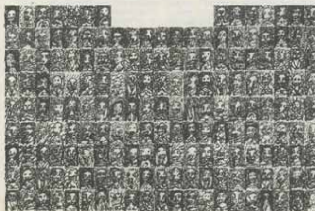
Antropograme, desen, 1994