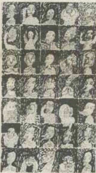
Antropograme, desen (detaliu)

Între cele două extreme descrise mai sus se află toate celelalte partide politice românești. La majoritatea acestor grupări, toate aflate în opoziție, principiul național rămîne dominant, juridicul ocupînd locul de unde a fost evacuat egalitarismul comunist. Tărăniștii bunăoară se arată tot mai puțin receptivi la revendicările ungarilor și, din motive diferite, tot mai distanți față de Biserica Greco-Catolică, care, la