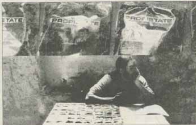
Comisia de impropietărire acțiune, 1992, Muzeul de Artă Timișoara, cu ocazia manifestării Pămîntul

Aceste piețe urmăresc reforma în domeniul comercializării produselor agricole, parte componentă a reformei în agricultură, în vederea programării României pentru intrarea pe piața europeană. (O.A.)