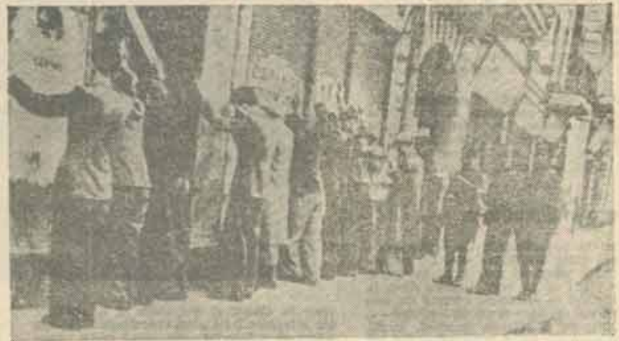
Iași 29 iunie 1941. Așa a început...