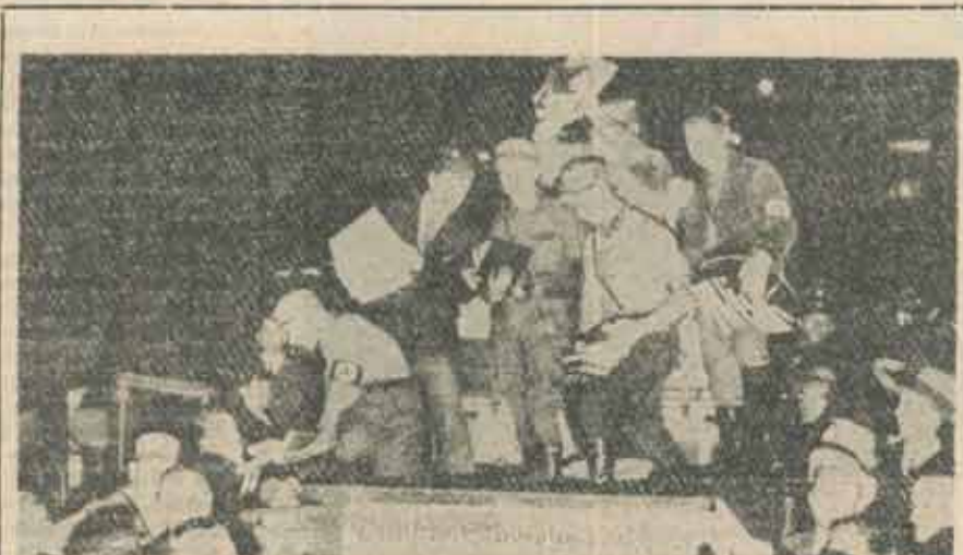
Germania, 10 mai 1933: nazii executînd cărți în stradă

(2) o perioadă în care corupția societății (burghezo-mogieresti) s-a acutizat într-o măsură scandalosă. Această situație a generat (1) o încredere în destinul istoric al mișcării, patronată cumva de un Dumnezeu care era, în sfîrșit, și al Românilor și (2) o exasperare produsă de injustiția socială, de imoralitatea deșănțată a puterii, de corupția din Parlament, Poliție și Siguranță.