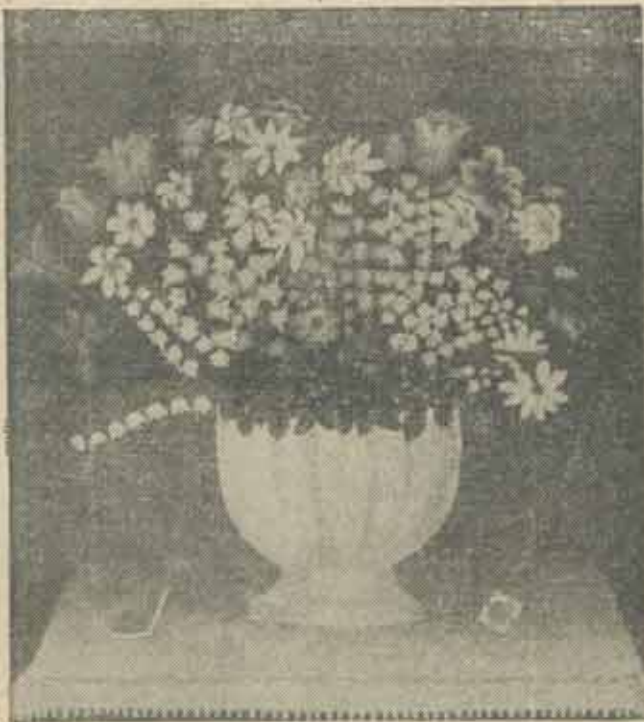
Ilustrăm acest număr cu lucrări din expoziția de pictură naivă românească de la Teatrul Național din București

„ANCHETĂ 22”: Cine vrea la Cluj un alt Tîrgu-Mureș. Problema școlilor.