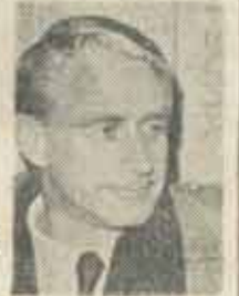
■ LASSE SEIM, ministru cu misiune specială din Norvegia