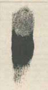
Ladislav Steiner (Cehia) - "Tragedie II" (gravură)