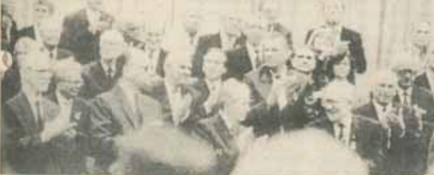
Reuniunea de la Berlin (1989) prilejuită de aniversarea Partidului Comunist din RDG a fost ultima întâlnire în viața a liderilor estici

Liderul est-german respinge aceste propuneri prin argumentul că prin astfel de măsuri "suveranitatea RDG-ului ar fi îngrădită", "deschizându-se porțile acelor cercuri care ar dori jefuirea țării".