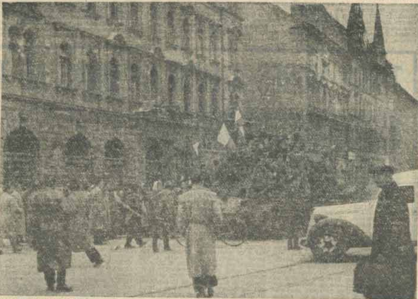
Budapesta, octombrie 1956