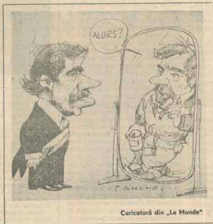
Caricatură din „Le Monde”

(După Libération, 18 Iulie 1991) Traducerea: CLARA POPESCU