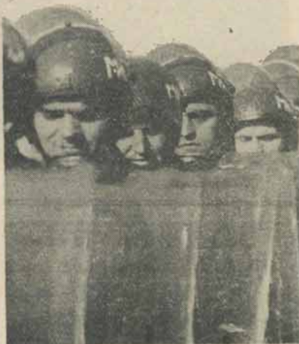
Ei asigură liniștea cozilor (august 1990)

ERATĂ. Traducătoarea prezentului studiu se numește SILVIA HOTĂRAN. Cerem scuze pentru „botzul” comis la publicarea primelor episoade