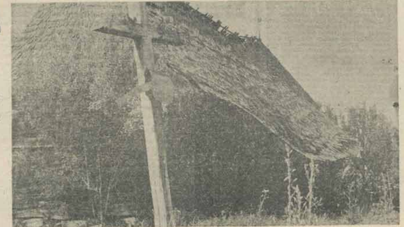
Șieu Sfântu (sec. XVIII) — jud. Bistrița Năsăud

Atunci când omul se confruntă cu dimensiunea sacrificiului, reacțiile lui sînt altema celor din preajma teofantel. Se înfloare, se roagă și ridică o