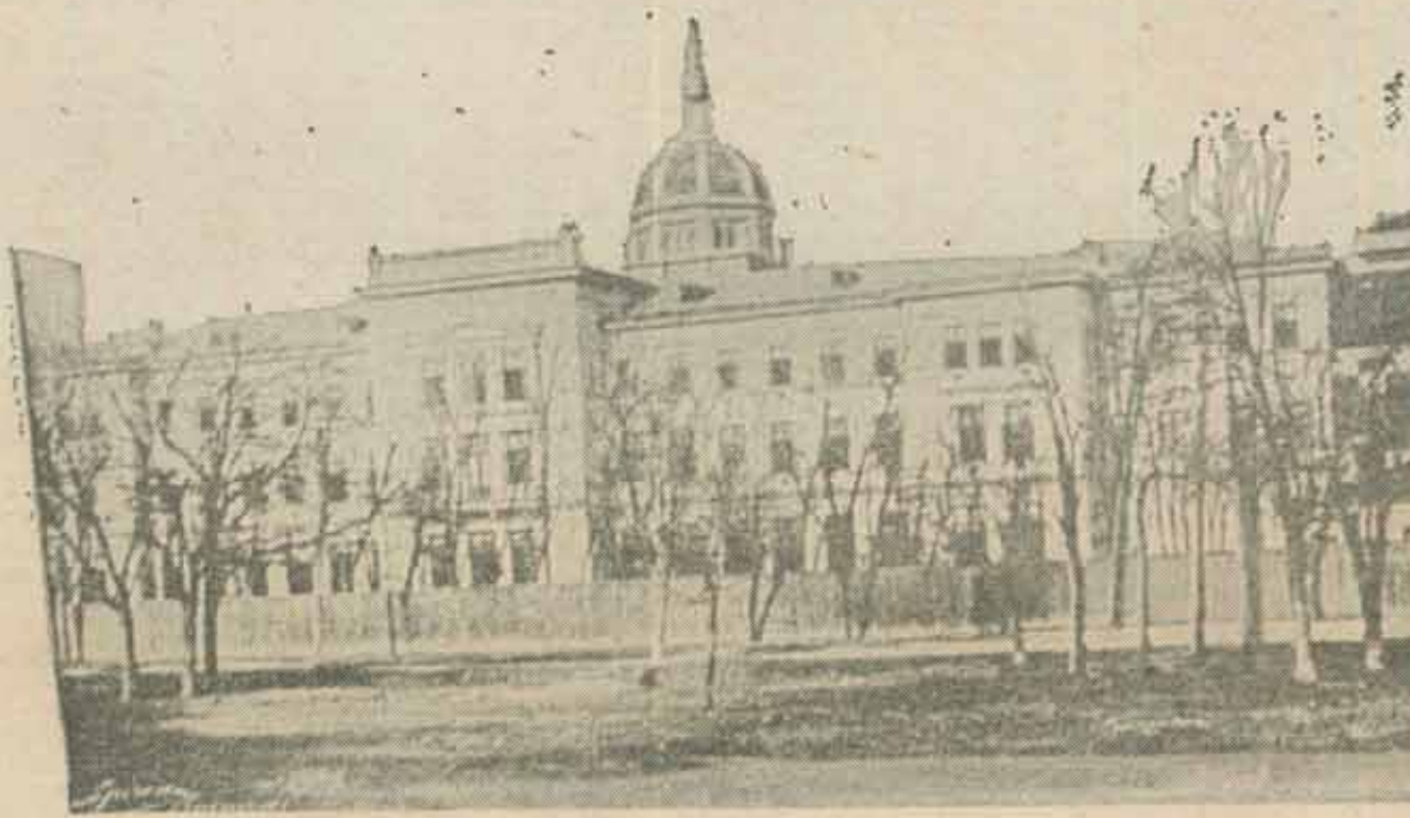
Azilul Elena Doamna și Ateneul „Elizabeta” în 1903.

Pentru cei ce, în drum spre casă, urcă dealul Cotrocenilor, pe lângă Academia Militară, peisajul lăsat în dreapta, pe strada doctor Bagdasar, zărit distrat prin geamul autobuzului, este de multă vreme intrat în subconștient. În spațiile celor câteva blocuri și cămine studentesce, se ghiceste Palatul Cotroceni, iar imaginația completează acum incinta fostei minăstiri și reședințe de vară cu ceea ce ne-a prezentat televiziunea după revoluție. Cei ce locuiesc pe străduța ce mărginește micul parc ce urcă odată cu noi dealul spre Șoseaua Panduri, se pot odihni vara pe o băncuță din incinta ce spăra un mormint așezat chiar lângă povirșul, aici abrupt, al dealului, mormintul Anicai și al lui Carol Davila. Câteva trepte de piatră, pe jumătate îngropate în rîpa dealului urcă spre mormint, venind de nicăieri. Drumul autobuzului trece peste șoseaua Panduri și, cotind spre Drumul Taberei, călătorul vede în dreapta clădirea fostului Institut Pedagogic, iar în spatele acestuia, ridicându-se solemnă, turta unei biserici. Din depărtare impusă de izolarea dorită pentru o reședință prezidențială, nu se vede bine starea de ruină a bisericii, nu te izbăște brutal impresia de tristețe și uitare, pe care o ai la apropierea de aceste edificii, așezate la cîteva metri de Palatul Cotroceni.