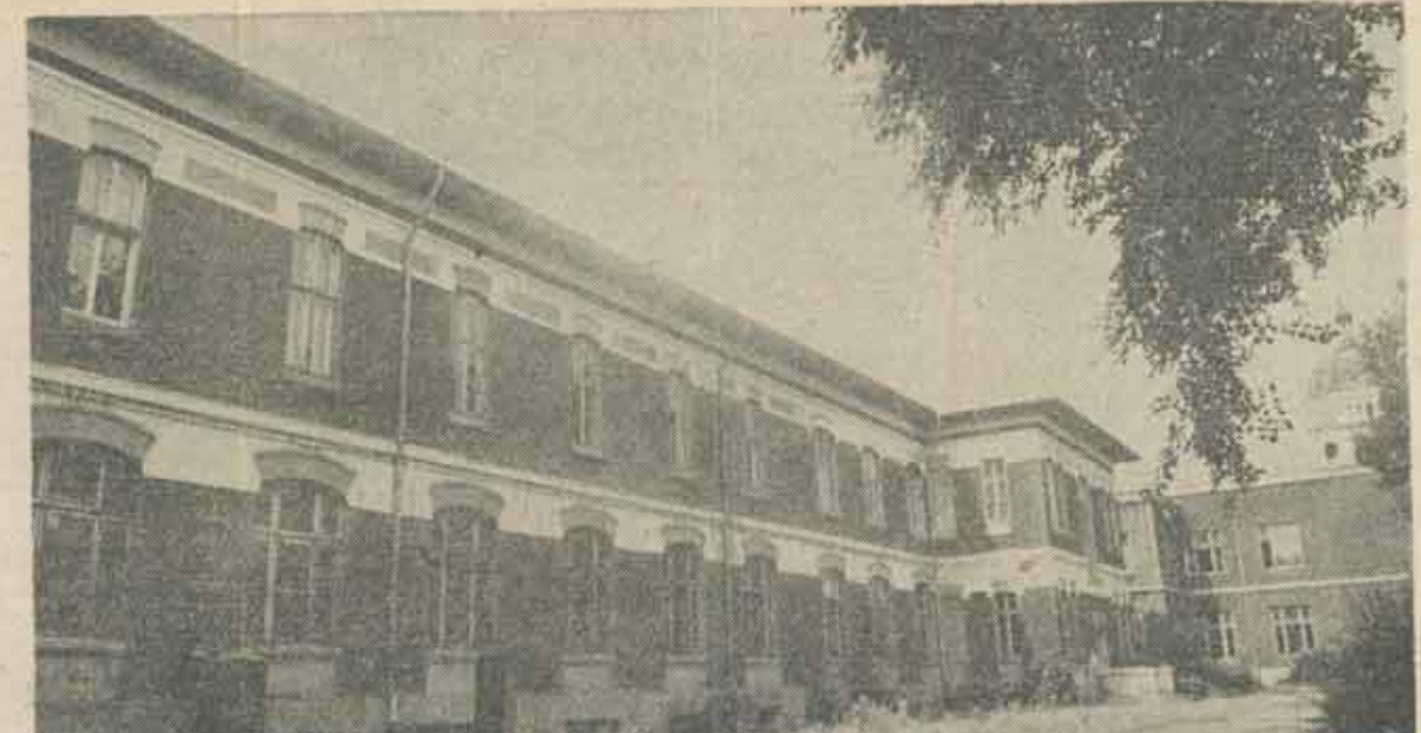
Curtea interioară a Azilului; piatra de temelie a fost așezată în 1862 de Elena Cuza, Alex. Ioan Cuza, Alexandru Davila și N. Kretzulescu

Istoria Azilului a fost întotdeauna legată de istoria Palatului Cotroceni, de istoria Dealului și Platoului Co-