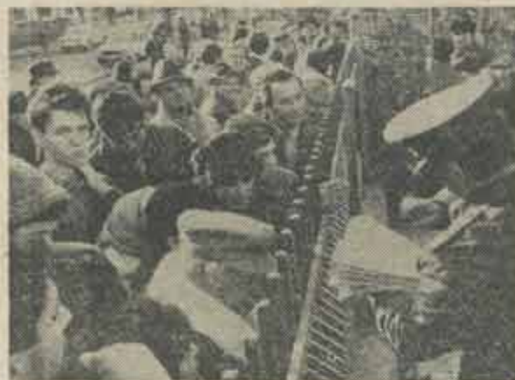
Coadă la ambasadă (iulie 1990)

În timp ce răspunsul ideologic cel mai puternic și acuzator la marxism-leninism a fost fascismul interbelic, cu diferitele sale variante, în perioada postbelică, în faza războiului rece, fascismul a fost înlocuit cu ciudații hibrizi ideologici, cum ar fi anti-comunismul liberal și conservator. Adevărul profund al anti-comunismului a constituit structura de bază a politicii. Politicile au pivotat în jurul marilor bătălii între lumea liberă și comunism. Bătălia, pozitivă, anti-comunistă (kitsch-ul american, cum a numit-o scriitorul ceh, emigrat, Milan Kundera) a constituit baza unui larg consens politic în America, cel puțin pînă la războiul din Vietnam. Chiar atunci cînd războiul a escaladat iar apoi s-a sfîrșit, încercările de conturare a unei politici naționale interne și externe care să nu țină cont