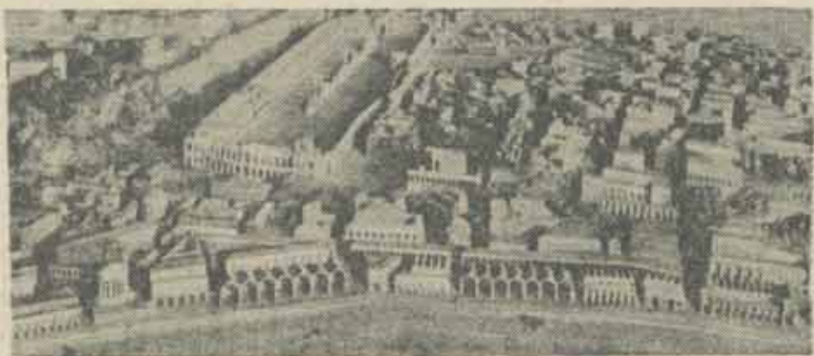
Roma antică (reconstituire)