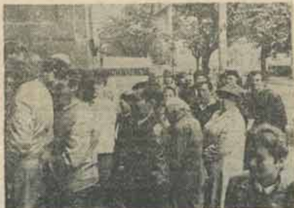
Coadă la votare (20 mai, București)

Cu astfel de observații a început critica ideologică de stînga. Marx a susținut că tinerii hegelieni de fapt au