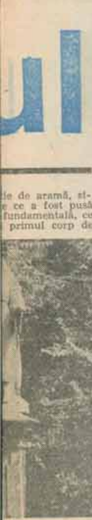
executată în 1879

Odată cu căsătoria Prințului Carol cu Elisabeta de Wied, Azilul are din nou o protecție, o ființă de o bună parte fără margini, sensibilă, cultă și care, după vizita pe care o face la Azil, convingându-se de calitățile și lipsurile acestuia, ia nobila inițiativă de a deschide o listă de subscripție pentru construirea unei capele — capela Elisabeta — și, conștient de lege, un Ateneu feminin care să completeze școala primară, cu studii secundare umanitare, școala normală, școala profesională, ateliere pentru încurajarea aptitudinilor artistice ale copiilor, în Ateneu fiind admise orfanii cu aptitudini deosebite și burse: admise prin concurs.