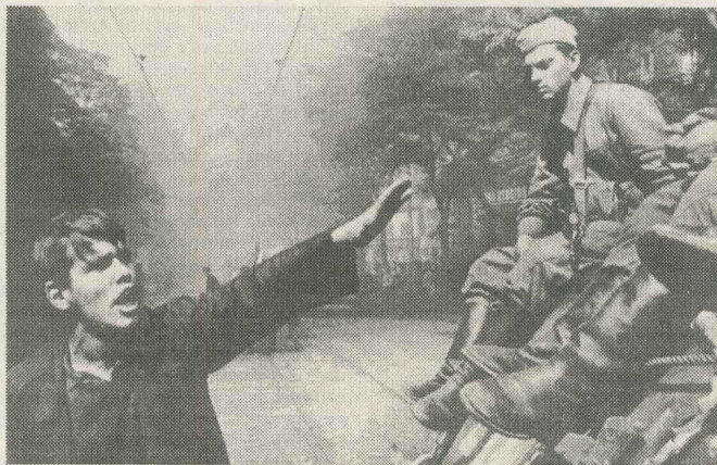
August 1968, invadarea Cehoslovaciei de către trupele Pactului de la Varșovia

marea opiniei publice în privința abolirii cenzurii și a formării asociațiilor politice și culturale independente. Reabilitarea lui Pătrășcanu și a altor activiști persecutați în perioada Dej este utilizată de Nicolae Ceaușescu pentru consolidarea propriului statut dominant în partid, iar nu pentru dezavuarea practicilor teroriste ale securității. Nici una din figurile de vîrf ale democrației românești, pierită ca victimă a represiunilor staliniste, nu este reabilitată. Sperația de schimbare este manipulată în chip insidios de către aparatul ideologic al PCR. Contractul