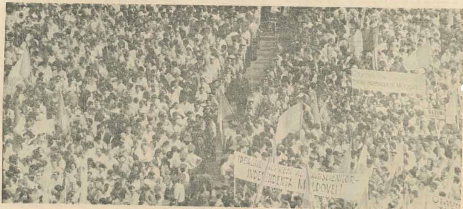
Chișinău 27 august 1991

Ceva trebuie reținut. Că în zilele puciului, tinerii moldoveni au venit fără să fie chemați și au apărut punctele strategice ale Chișinăului, televiziunea, clădirea Parlamentului, sediul Guvernului și toate celelalte instituții a căror eventuală cucerire ar fi fost foarte periculoasă pentru democrație. Asta ne dă cea mai mare speranță, faptul că tinerii nu vor mai ceda niciodată ceea ce s-a cîștigat atît de greu și cu atîta chin.