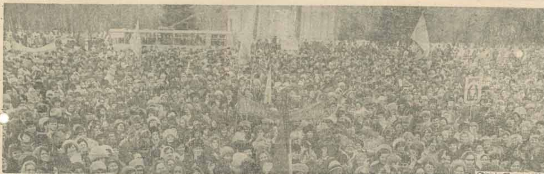
Chiriacu-27 august 1991