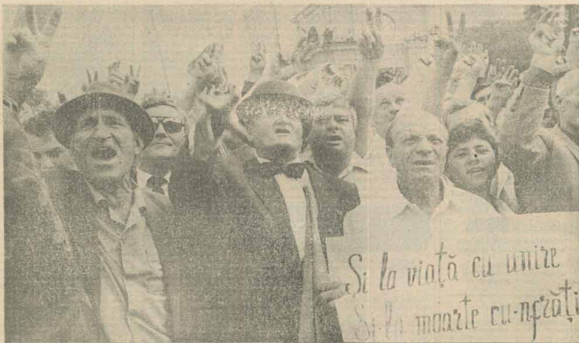
Chișinău, 27 august 1991

Sfârșit de august în Europa: declanșarea războaielor mondiale, dictatul de la Viena; insurecția poloneză și cea română; momente în care timpul istoric intră, frenetic, în autoacelerare. Mai curînd: invazia sovietică în Cehoslovacia. Și, curînd de tot — sfîrșitul Marelui Bolnav.