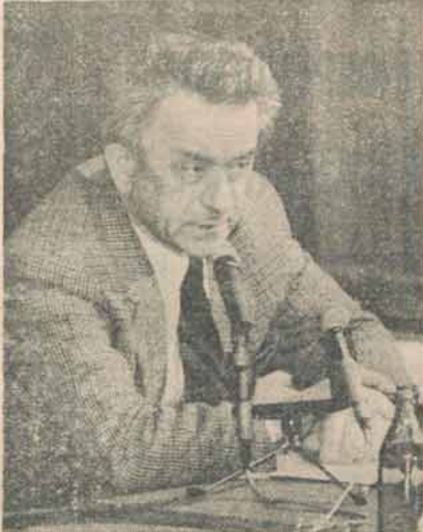
În mai '90 mai aveam o speranță