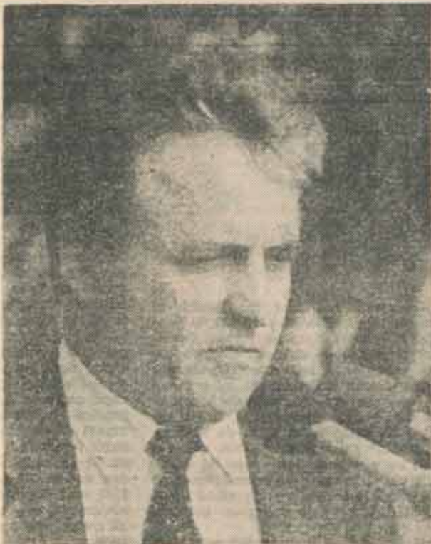
„Cine nu a locuit în ultimii 10 ani în Cartierul Primăverii nu are dreptul să candideze”

D-le Mircea Druc, cum interpretați contestat a împotriva candidaturii dvs. la funcția de președinte?