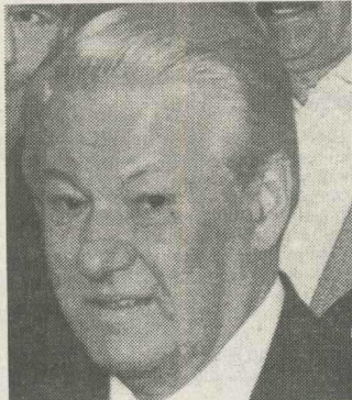
Președintele Elfin între comuniști și naționaliști

României, nu aveam o bază solidă pe care să o interpretez și să încerc să trag concluzii. Un demers solid nu se putea face decît apelînd la cercurile de experți. Am adresat un set de 7 întrebări pe probleme generale de securitate la 5 grupuri de experți (senatori și deputați din cadrul comisiilor de apărare și de control al SRI din cele două camere ale Parlamentului; specialiști din cadrul Serviciului de Informații Externe; experți militari – ofițeri și civili – din cadrul Ministerului Apărării Naționale, Departamentul pentru Politici de Apărare; studenți de la Colegiul Național de Apărare; studenți de la Facultatea de Științe Politice și Administrative, Universitatea din București), compuse fiecare din cite 25 de persoane. La prima