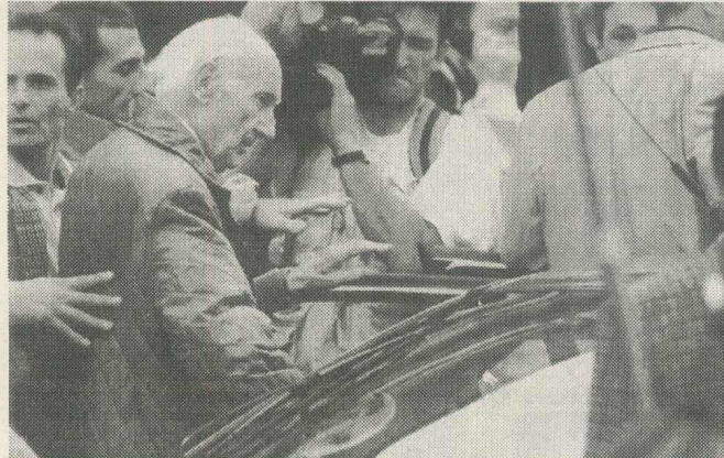
Sosirea lui Maurice Papon la Bordeaux la 7 octombrie 1997

Sinceră – pentru că întrebarea cea mai chinuitoare nu este cea a fanatismului, nici a rasismului, ci aceea de a înțelege cum a fost posibil ca un funcționar republican, capabil în anumite ocazii să-i ajute pe evrei sau pe membrii mișcării de rezistență, să devină complice la crima împotriva umanității? Prin ce alunecări succesive, „ramură după ramură”, așa cum s-a exprimat în pledoaria sa Arno Klarsfeld, un tinăr ambițios, a putut accepta să acopere sub autoritatea sa un serviciu a cărui activitate consta în a organiza, pentru ocupantul german, expedierea bărbaiților, femeilor și copiilor în vagoane de marfă, către o