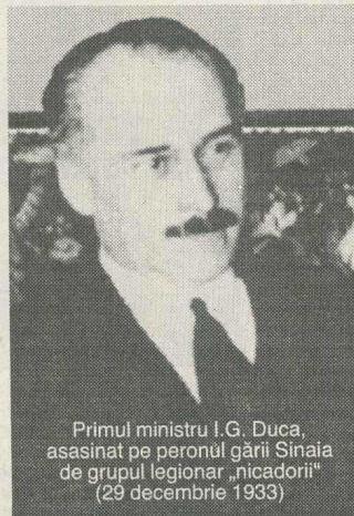
Primul ministru I.G. Duca, asasinat pe peronul gării Sinaia de grupul legionar „nicadorii” (29 decembrie 1933)

29/30 mai 1938, 252 frunții în 21 septembrie 1939 în lagărele din Miercurea Ciuc (din „publicul” lui Nae Ionescu!), Vaslui etc., ca și zeci de alți legionari în toată țara. Riposta legionarilor rămași „afară” nu infirize: se trage asupra rectorului Universității din Cluj, Florian Ștefănescu-Goangă, în noiembrie 1938 („vina” lui a fost, pare-se, hotărîrea de-a fi desființat niște cantine studentești în februarie 1937), premierul Armand Călinescu pe 21 septembrie 1939, coordonatorul „prigoanei” antilegionare (asasinii lui, ca și 252 frunții legionari pomeniți mai sus, sînt asasinați în replică în aceeași noapte), 64 foști miniștri și oameni politici inovoați și ei de „prigoană”, în închisoarea de la Jilava pe 26/27 noiembrie 1940 (ei fuseseră închiși aici de noul stat național-legionar al lui Antonescu și Sima), asasinarea lui Iorga și Madgearu, pe 30 noiembrie 1940 (replică la asasinarea lui Codreanu exact 2 ani mai înainte).