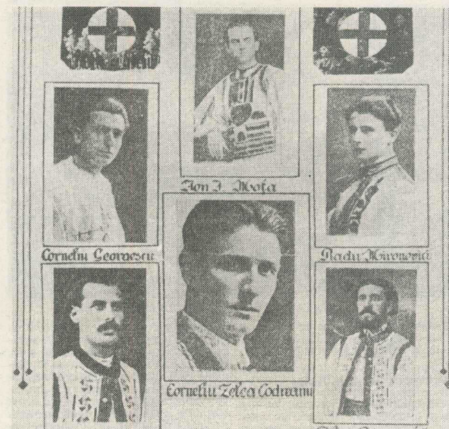
Întemeietorii Legiunii (Teodosie Popescu, Corneliu Georgescu, Ion I. Moța, Radu Mironovici, Ilie Gârbeață) și căpitanul lor Corneliu Zelea Codreanu

este integral, ci rezumativ, el constituie, cred, cea mai importantă încercare de-a defini teoretic cîteva principii ale „gîndirii legionare”. Retorica vagă și sentimentalitatea apasă din scrierile lui Codreanu și Sima cristalizează aici, în contact cu acuitatea gîndirii lui Nae Ionescu, în formulări limpezi: ele constituie de-aceea o bună bază de discuții. Aceste texte sînt, după Papanace, lipsite de „vraja specifică” vorbitorului: o situație cunoscută din reeditarea tuturor cursurilor lui Nae Ionescu, de-altfel, dar care are și aspectul pozitiv că înlesnește discuția conceptelor în sine. Pe de-altă parte „vraja” lui Nae Ionescu merită discutată în sine. Ea acționa la Miercurea Ciuc în cadrul unei „scene didactice” care revenea acolo la vechiul învățămînt oral al magistrului în fața elevilor. Z. Ornea a