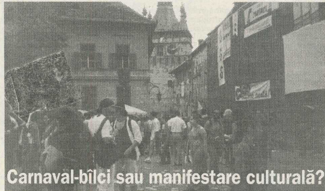
Carnaval-bîlci sau manifestare culturală?

Fără să am experiența anilor trecuți, mi s-a părut că festivalul pendulează cumva între carnaval-bîlci și manifestare culturală. Anul acesta, au fost prea multe clownisme, de tipul pantomimei sau al strîmbăturilor teatrale, care au creat, pe alocuri, o atmosferă de bazar. Mi s-a părut că nu s-a urmărit cu seriozi-