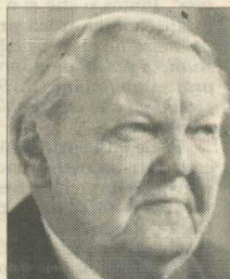
Ludwig Erhard (CDU) 1963-1966