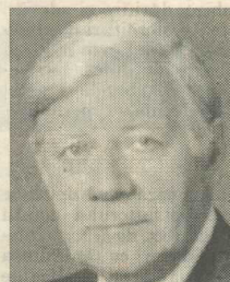
Helmut Schmidt (SPD) 1974-1982