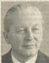
Kurt Georg Kiesinger (CDU) 1966-1969