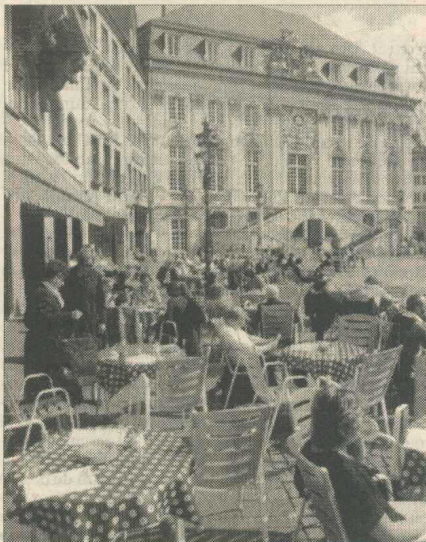
Vechea primărie în stil baroc din Bonn

Mult mai aproape de nucleul Europei Occidentale, de capitalele sale, Bruxelles și Strasbourg, mai cosmopolit prin structura populației, mai „european“ prin tradiția ultimilor 40 de ani, când Germania de Vest s-a reconstruit din ruine, construindu-și și o solidă tradiție democratică, Bonn-ul speră că va continua să joace și în viitor un rol important ca centru administrativ, științific și cultural al Germaniei și Europei. Acesta este și scopul centrului promoțional organizat la nivelul Primăriei, care schițează un marketing pentru Bonn și regiunea Rhein-Sieg Ahrweiler. Proiectarea viitorului se desfășoară însă pe fundalul unui prezent nemulțumit sau măcar neliniștit. De la studenți (mulți, 48.000) până la taximetriști, ca să nu mai vorbim de demnitari, de parlamentari, de înalta birocrație, mutarea capitalei de la Bonn la Berlin este percepută ca o situație necesară, dar frustrantă. Un preț local plătit