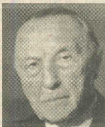
Konrad Adenauer (CDU) 1949-1963