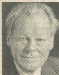
Willy Brandt (SPD) 1969-1974