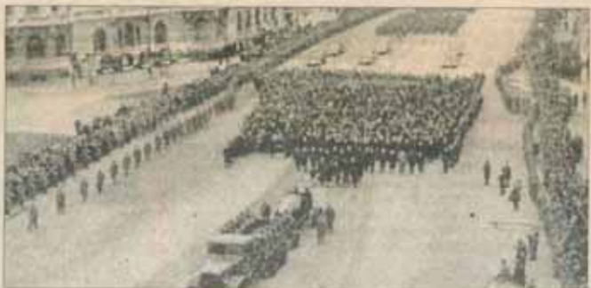
Funeraliile lui Gheorghiu-Dej (fotografie apărută în Flacăra Sibului din 26 martie 1965)

În interiorul esalonului de la vîrf al PMR, conflictul dintre grupul din jurul Anei Pauker și cel din jurul lui Dej a atins apogeul în 1952. Între martie și mai se produce eliminarea, arestarea celor trei și anchetarea lor. Se va încerca o conexie cu Pătrășcanu pentru a monta un proces tip Rajk, Slanski sau Kostov. Era o reacție a Kremlinului după defectiunea lui Tito. Se caută comunisti naționaliști, deviaționiști de dreapta și de stînga, lichidatoriști, împăciutoriști, trădători, agenți imperialiști, complici ai elicii lui Tito, dușmani strecurați în interiorul partidului (vezi Gheorghiu-Dej, Articole și cuvîntări , 1951, „Pentru puritatea rîndurilor partidului”). În acest context, în plinara CC al PMR din 29 februarie-1 martie 1952, Luca este criticat într-o ședință a Biroului Politic și demis, împreună cu conducerea ministerului și a Băncii Naționale: „Ei au încălecat linia partidului în probleme financiar-bancare, contraponind liniei partidului o linie a lor antimarxistă și contrarevoluționară caracterizată prin sabotarea sistematică a țării și prin spinierea prin toate mijloacele a creșterii elementelor capitaliste în economia națională, îndeosebi la sate”. Acuzația era „deviere de dreapta” și constituia o reluare, practic în aceeași termeni, a acuzațiilor din procesul Buharin. Dat fiind amestecul consilierilor sovietici, nu surprinde folosirea aceleiași metodologii și a aceluiași vocabular. Operații identice se produceau în toată Europa de Est.