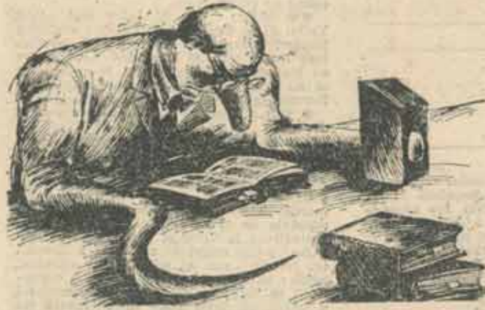
Grafică de VIACESLAV BIBICEV

● M.C.: O întrebare de strictă actualitate: ce credeţi, de la distanţă privind lucrurile, despre „Vatra Românească”?