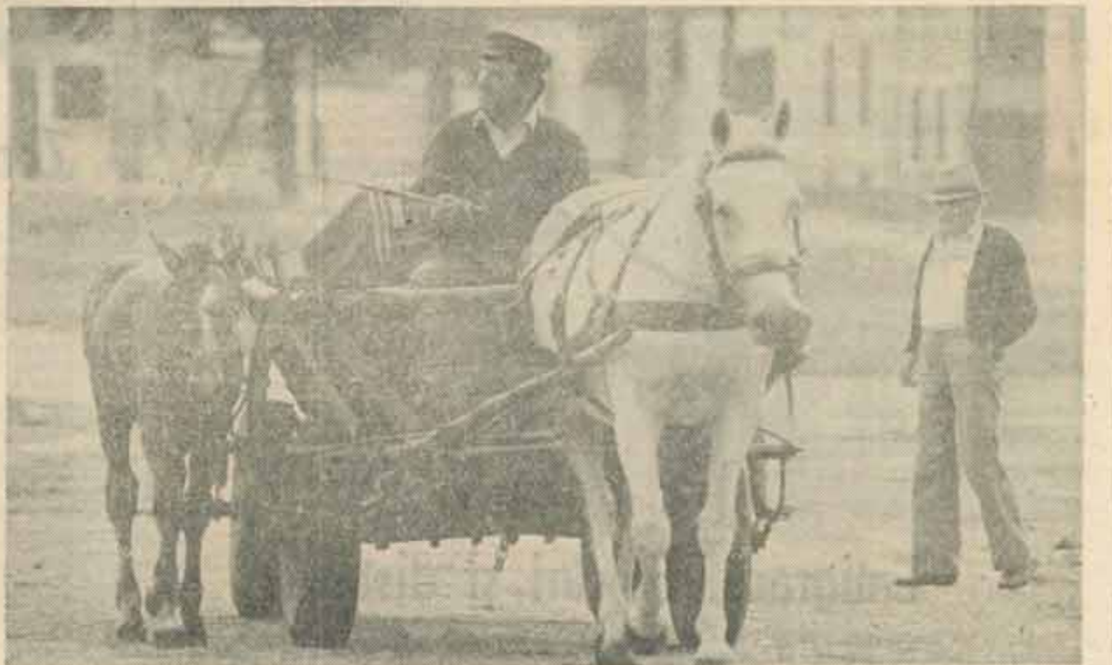
Cărăușie „privatizată” la Feldioara

rentei. O marfă se vinde la București cu un preț dublu față de cel stabilit de întreprinderea producătoare situată la 500 km distanță pentru că accesul la cea marfă în capitală este limitat la oferta intimidatoare, în cazul bun, sau manipulat, în cel rău. Pretul la bunurile de import (banala bere), care exorbitant în lei pentru că el se aliniază la cursul de pe piața „neagră” a dolarului și nu la cel oficial, bonurile de valoare se vor putea vinde la prețuri derizorii doar în măsura în care deținătorii lor nu pot sau nu știu să le utilizeze în calitate de capital. Lipsa de informație de piață, distorsionarea cursurilor, ignoranța în probleme financiare, lipsa de alternative investitoriale reale pot