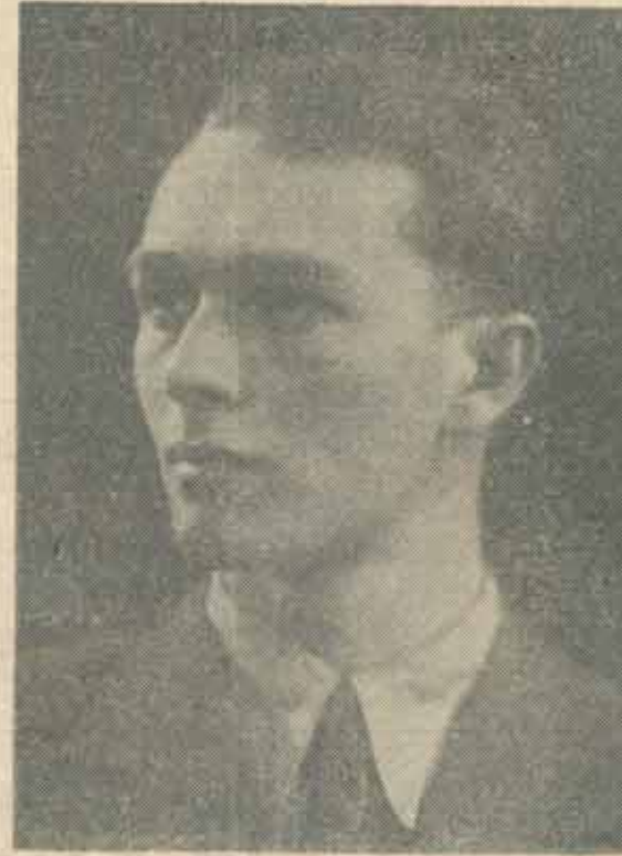
O fotografie din 1945