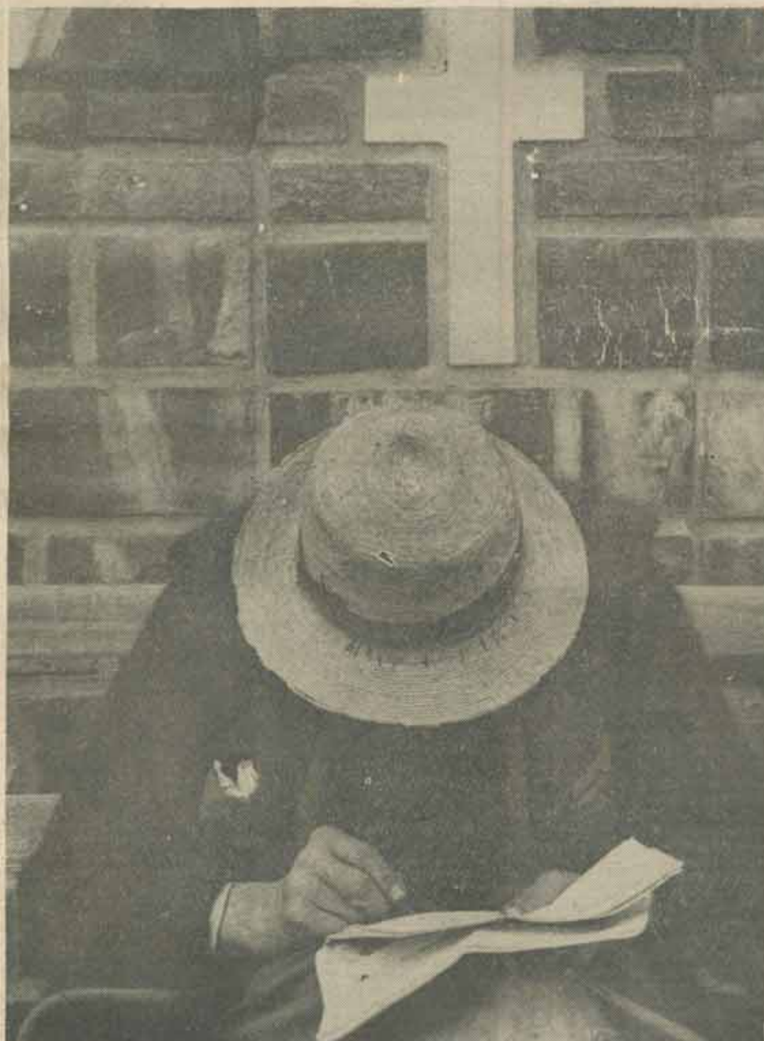
Setea de informație — instantaneul e de la Săpînța. Setea e prezentă și în alte așezări...