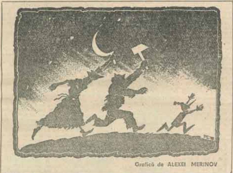
Grafică de ALEXEI MERINOV

Două consecințe are acest din urmă interviu: prima e aceea a deschiderii fam-