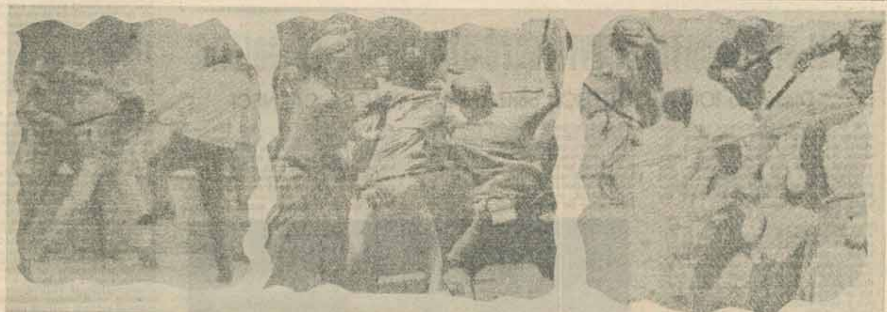
Din „cronica” ocelor zile