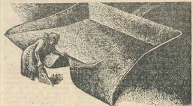
Grafică de MIHAI IGNAT

● M.L.: Total! Pot să spun că aproape tot ce publică ziarul AZI (ca să nu mai vorbesc despre România Mare, care este toată o insultă), deci ca să nu e Kagere spun că AZI ar trebui să aibă aproape pentru fiecare articol un proceș, iar România Mare aproape pentru fiecare frază. Așa că în Franța există mereu procese, dar nu chiar sînt, pentru că aici nu există reunio în un loc, AZI, Libertatea și România Mare. Există două-trei ziare de scandal, în rest presa este responsabilă. Toți ziarocul bucureștine enumerate ar fi de neînchipuiți în Le Monde, Le Figaro, Liberation ori Le Quotidien de Paris. Și nu vreau să