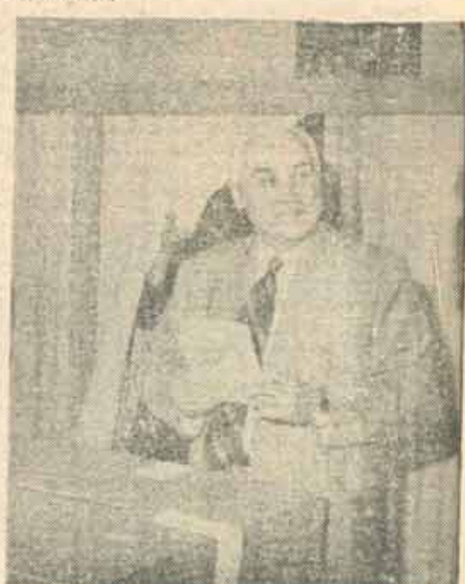
■ Președintele unui partid neparlamentar ?