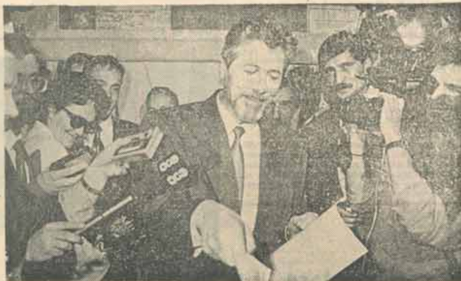
■ Dacă nu ei, atunci cine?