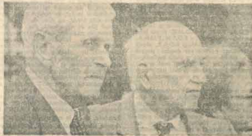
■ Amintiri despre viitor...

nismul, dosarele de la Securitate, mînerii, monarhia etc. Este trist, dar foarte adevărat, că poporul nu a reacționat și nici nu reacționează la acest gen de „propagandă” și că sînt foarte puțini cei care au nevoie de adevărul cerut în piețele Timișoarei și Bucureștiului. Nu funcționează de cit de comunist sau disident a fost cineva, nu funcționează de numărul anilor petrecuți în puscăriile comuniste sau în ierarhia de partid, votează fără nîm, muncitorimea, funcționarii, gospodinele, pensionarii sau chiar tinerii (precum s-a văzut). Criteriile sînt cu totul altele și deocîndată confuze, dar este evident că nu sînt cele pe care vechile partide s-au străduit a le ridica la rang de principiu. După alegeri, formal aceste criterii trebuie lîmpezite și analizate, altfel riscîndu-se intrarea într-un cerc vicios. Poate tocmai în preajma confuziei dintre ideal și realitate, dintre importanța trecutului și semnificația prezentului, să se afle explicația faptului că, după doi ani de existență, P.N.T.C.D. nu a reușit să depășească procentul de 10,5% (dat de mai toate sondajele de opinie). Nu sînt ferm convinși că această teorie este valabilă, dar cred că ancorarea în trecut, nedefinirea concretă a noțiunii de anticomunism nu sînt de natură a atrage electoratul. Este clar la ora actuală că „masele” nu sînt preocupate nici de KGB, nici de securiști sau informatori, nici de cine a chemat mînerii și