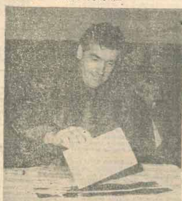
■ Petre Roman — încă optimist.