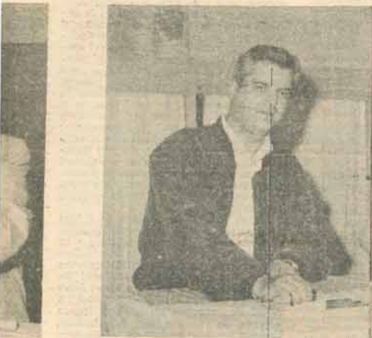
■ Un posibil prim-ministru.