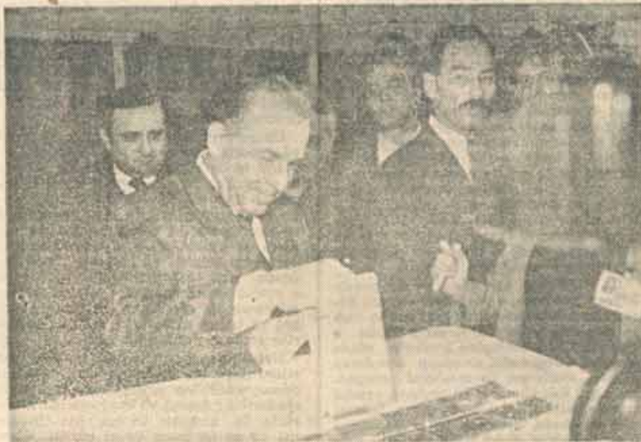
■ Candidatul I. Iliescu: „Pentru unii, acest popor este necorespunzător”.

Semieșecul acestor alegeri trebuie să dea de gînd în primul rînd Convenției Democratice și în particular P.N.T.C.D.-ului. Deocîndată am apucat-o iarăși pe un drum infundat!