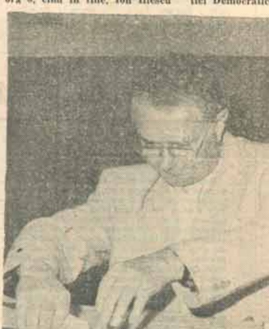
■ Stabiliind echidistanța...