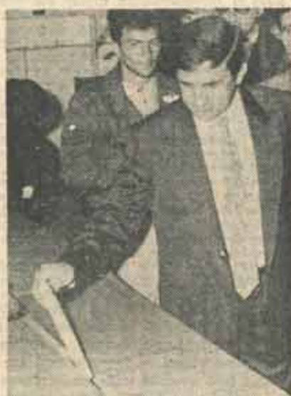
Ioan Mănzatu, Gh. Funar și Mircea Druc