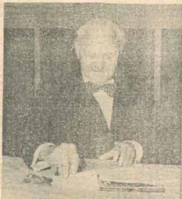
■ Un democrat care știe cu cine să voteze