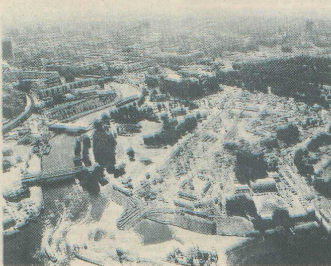
Berlin. Vedere asupra rîului Spree cu Reichstag ul în timpul reconstrucției. În prim-planul fotografiei amplasamentul noii Cancelarii Federale .

În inima Berlinului, între Leipziger Strasse și Niederkirchnerstrasse, se află odinioară imensul ansamblu arhitectural al Ministerului Aviației din timpul Reich -ului. Cele 2.400 de birouri la care se accede printr-un culoar de 300 m amintesc de megalomania de altădată. Viitorului stăpîn al casei, ministrul federal de Finanțe, Theo Waigel, îi rămîne de văzut ce va face cu această clădire. Deviza adoptată - să se acționeze cu moderație - înseamnă o reducere simțitoare a efectivelor, înaintea mutării definitive de la Bonn la Berlin, prevăzută pentru mijlocul lui 1999. S-a luat decizia ca 54% din posturile minis-