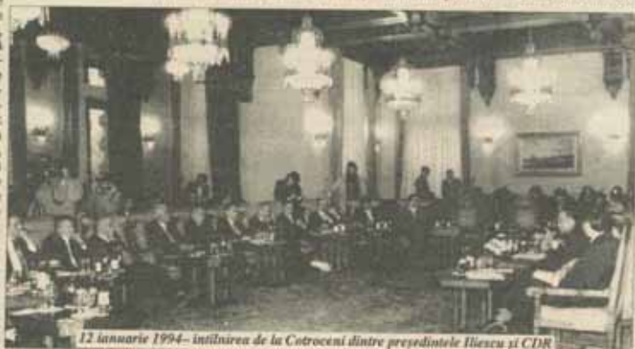
12 ianuarie 1994 - întrunirea de la Cotroceni dintre președintele Iliescu și CDR

NICOLAE CERVENI: Schimbarea în această țară, în stadiul în care ne aflăm, se poate face în trei feluri: printr-o mișcare de stradă, ale cărei finalități nu pot fi prevăzute, prin noi alegeri parlamentare, care pot înădă să nu rezolve problema, și se mai poate face prin intervenția președintelui țării. Pentru că eu vreau să vă spun clar și ritos: dvs. nu vă puteți ascunde, dacă vreți s-o faceți, după dispozițiile constituționale. Pentru că dumneavoastră puteți mult mai mult decît prevede Constituția în această țară. Să nu ne trimiteți pe noi