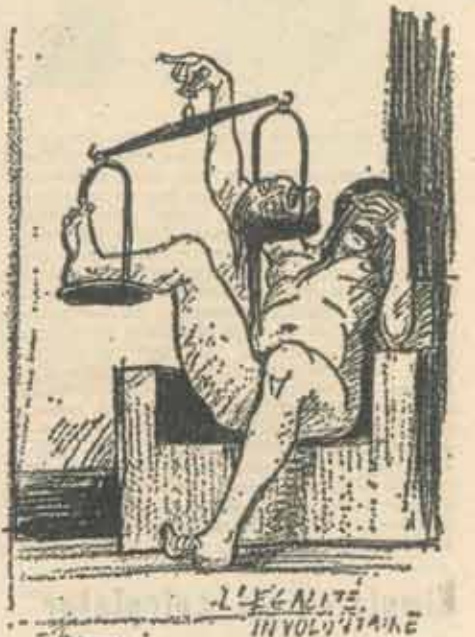
● Ilustrăm acest număr cu lucrări din ciclul Revoluție-devoluție (dedicat bicentenarului Revoluției Franceze), aparținînd graficianului asocian JEAN THOMAS UNGERER