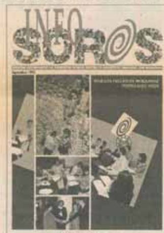
INFO SOROS Buletin informativ al Fundației Soros pentru o Societate Deschisă din România

Înainte de '89 am absolvit Facultatea de Energetică și lucram la Institutul de Studii și Proiectări Energetice. Primul anuș dat de Fundație pentru angajări l-am citit în revista „22”. Aveam nevoie de o schimbare, fiind extrem de nemulțumită de ceea ce făceam, de ceea ce am studiat. Așa am avut șansa unică de a porni o fundație al cărei impact nu l-a putut anticipa nimeni de la început.