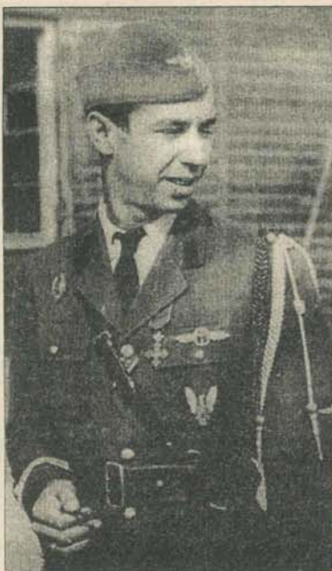
Cum a ajuns Tudor Greceanu în 1949 în închisoare?