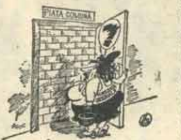
Desene de ADRIAN ANDRONIC

al pietrelor de domino. Ne răpăcise nădejdea. (T.P.S.) ●●● ●●● „LOST IN SPACE” LA AEROPORTUL OTOPENI. Cînd lei intrarea. Cafeaua douăzeci. Așteptarea, cit te țin nervii. Si inima. Pentru că poți ușor face un atac de cord din cauza serviciului de informații. Si a proastei organizări, a indiferenței, vecină cu... Pe tabela de afișaj, apar curse care nu vin, în schimb voci stîșite anuntă după ce se aude cite un uruit de motor „Cursa de New York a sîrizat”. Dar respectiva cursă nu e trecută pe tabelă, nici cea de Moscova care trebuie să vină în