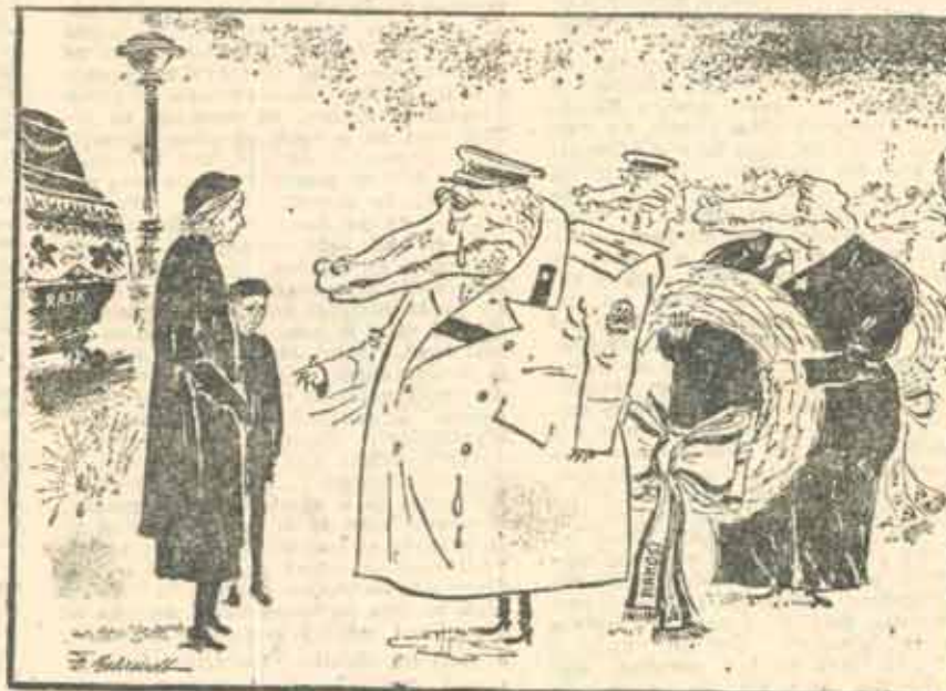
Lacrimile de crocodil ale condoleanțelor, 1965 - Ungaria; la reinhumarea lui Raik și a celorlalți personalități executate mișelește în 1949.

Pe lîngă problema locurilor de muncă o situație și mai dificilă este aceea a locuințelor. Problema acută în marile orașe ungare și mai ales în Budapesta, pentru refugiați aceasta este, fără îndoială, cel mai greu de rezolvat. Se stă la cămine, în cazărni dezafectate, se închiriază camere proaste al căror preț