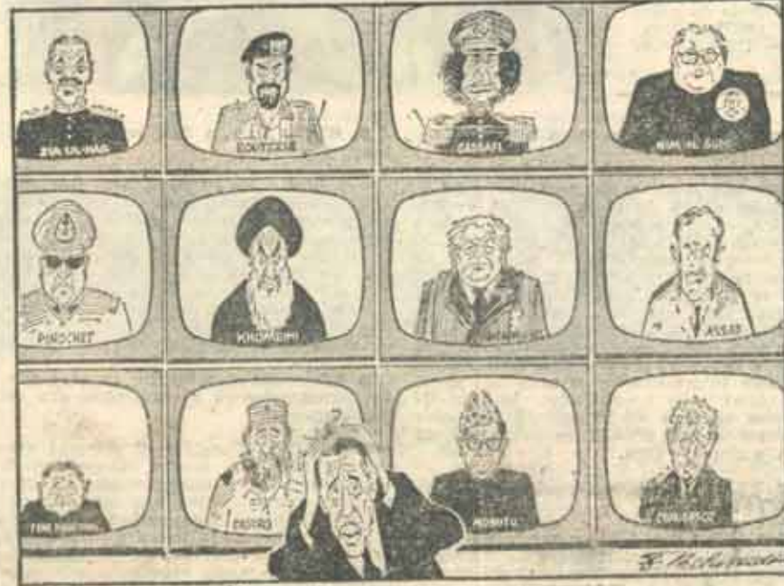
1984 — Big Brother-ii lui Orwell sînt destul de numeroși.

Fără îndoială, abandonarea politicii comuniste nu este același lucru cu abandonarea politicii imperiale. Centrul