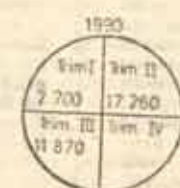
Nr. de oameni care au trecut pe la Biroul de înregistrare; lot de refugiați din România în cele două luni din 1990

comentarii convenționale și date seci, aspectele mult mai complexe, cîteodată incomode ale prezenței în Ungaria a zecilor de mii de refugiați din România, implică o maximă responsabilitate.