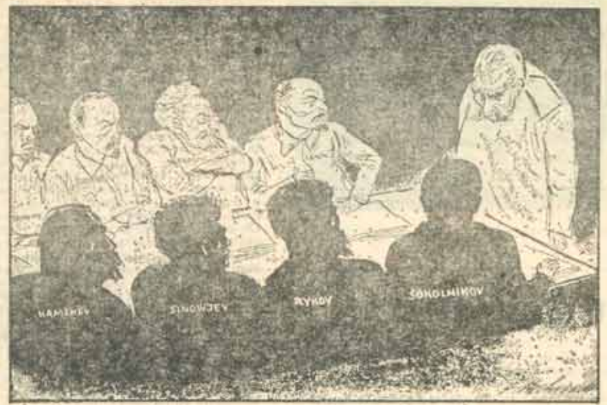
La 5 martie 1953 moare Stalin. Vechiul Birou Politic e din nou împreună, în ceruri, dar în care cer?

semna activitate ostilă împotriva statului?