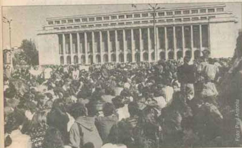
Față în față cu Guvernul

spre Facultatea de Drept, unde până la ora 12.00 sînt aproape 10.000 de protestatari. Coloana se îndreaptă spre Piața Universității, oprindu-se apoi în Piața Palatului.