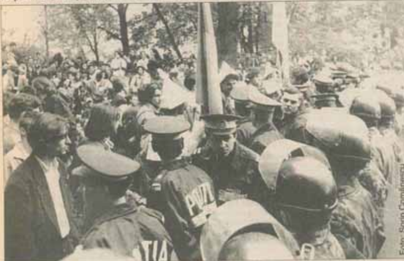
Față în față cu forțele de ordine