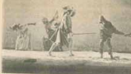
Piccolo Teatro di Milano. Insula sclavilor de Marivaux în regia lui Giorgio Strehler