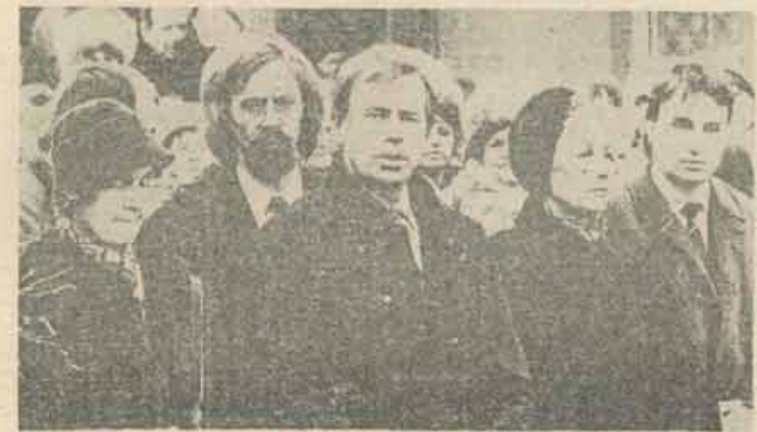
Havel și soția la comemorarea fostului președinte T. G. Masaryk