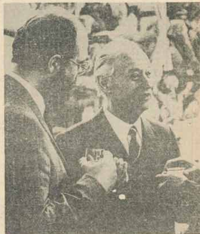
Alexander Dubček — trecut și prezent

(După Timothy Garton Ash, în „Lettre Internat-Printemps 1990)