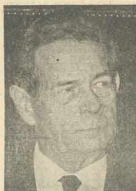
GALERIA CU REGI: Carol I, Ferdinand, Carol II, Mihai I