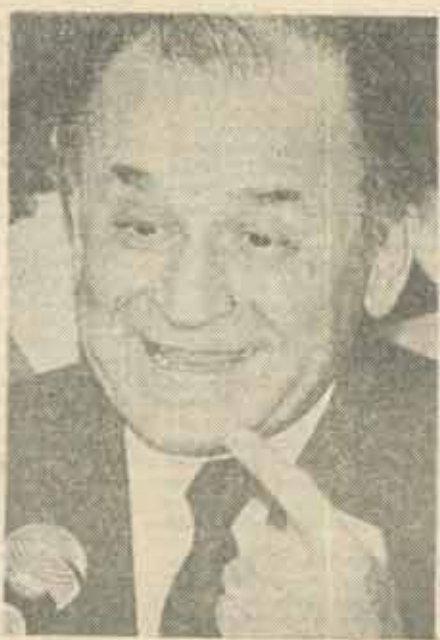
GALERIA CU PREȘEDINȚI: Nicolae Ceaușescu, Ion Iliescu