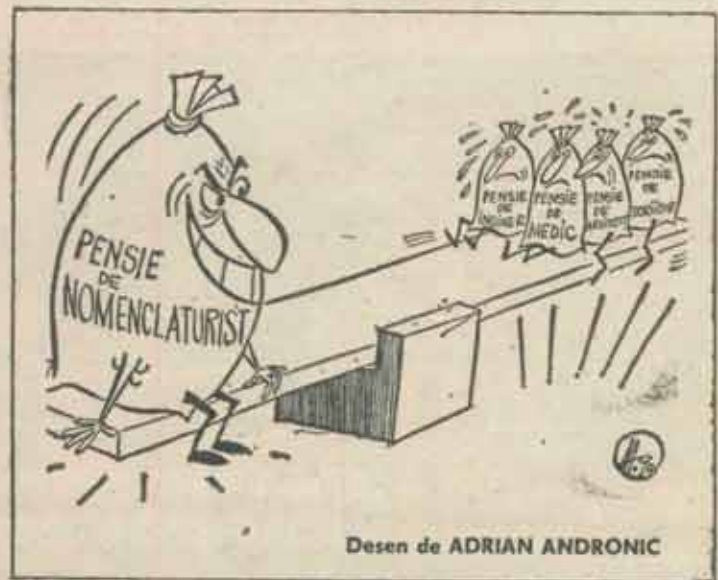
Desen de ADRIAN ANDRONIC

Textul înscris pe diplomă este următorul: