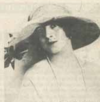
Regina-Mamă Elena a României

Bucureștiul, cu enorma sa ofertă de benzină, are mai multe automobile decît toate capitalele est-europene la un loc. Cu excepția unei dozi de limuzine Lincoln, seria 1946, ce-i poartă pe ștabii comuniști, toate celelalte sînt fabricate înainte de război. E criză de anvelope. Uneori vezi automobile cu trei anvelope, cea de-a patra roată fiind din lemn.