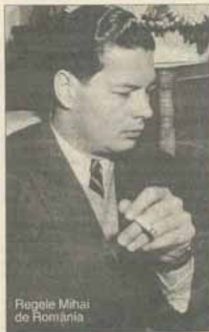
Regele Mihai de România