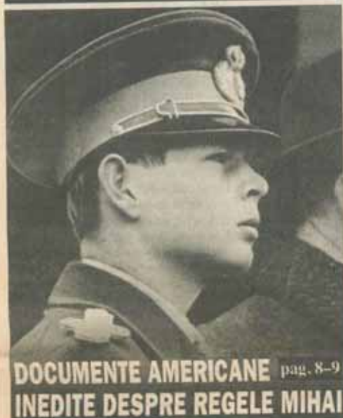
DOCUMENTE AMERICANE pag. 8-9 INEDITE DESPRE REGELE MIHAI