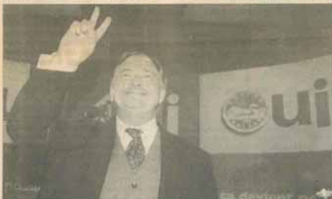
Jacques Parizeau, primul-ministru Quebec-ului, în timpul unui miting electoral (9 noiembrie). Pe atunci era convins că Quebec-ul își poate cuceri independența fără a se ajunge la o ruptură totală de Canadea

Traducere și adaptare după revista „Time” de ADRIANA TUDOR