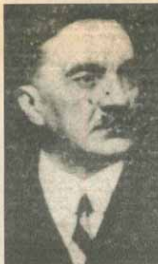
„Comuniștii le e frică de Maniu și fac tot posibilul să-l compromită popularitatea - imensă, îndeosebi în rîndurile tineretului”

Petru Groza vrea să prezinte aceste alegeri ca pe cele mai libere din Balcani.