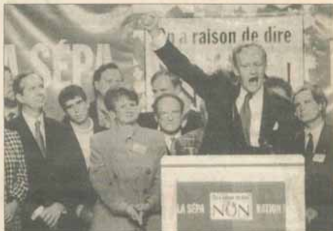
Primul-ministru canadian Jean Chrétien a vrut dintotdeauna să evite separarea; la 6 octombrie, el a adresat un avertisment locuitorilor Quebec-ului, dîndu-le de înțeles asupra consecințelor grave ale unui eventual „Da”

Recunoscînd înfrîngerea, răposatul fondator al Partidului din Quebec și premier al Quebec-ului, René Lévesque, le spunea pe atunci adeptilor îndurerăți: „A la prochaine!”. Astfel, o a doua respingere a însemnat o înfrîngere copleșitoare. Actualul lider al Partidului din Quebec și premier al Quebec-ului, Jacques Parizeau, a făcut tot ce i-a stat în putere să-i atragă pe indeciși, cu o întrebare de referendum menită să alunge tamerile față de un haos economic posibil după cîștigarea independenței: „Sîntezi de acord ca Quebec-ul să devină suveran după ce va face Canadei o ofertă de nou partenerat economic și politic, în limitele legii prin care se respecta vîntorul Quebec-ului și ale acordului semnat la 12 iunie 1995?”. Limbajului