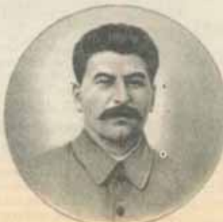
„În localuri publice, fotografia lui Stalin ocupă locul central”

Constanțenii așteaptă cu nerăbdare vaporul de marfă american, care a rămas singurul mijloc al lor de legătură cu îndepărtatul Occident. Aceste