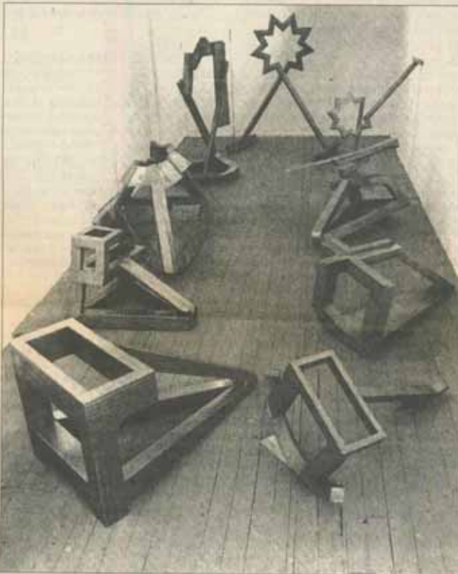
„Nouă stațiuni catalitice“ (1988)

O sculptură de-a sa vrea să fie nu doar un obiect estetic tridimensional și compact, ci și modelul palpabil al unui „spațiu răscut“, „spiralat“. Un desen la el nu e doar schița pregătitoare a unei viitoare lucrări finite, ci vrea să fie și diagrama unei viziuni non-liniare, holistice, a nivelurilor suprapuse și interactive ale realității unui obiect. Un happening, o performanță nu vor să fie la el doar forma provocatoare a unui exhibiționism individualist de duzină, ci o formă de participare totală a artistului împreună cu publicul la ritualul redescoperirii lumii ca entitate