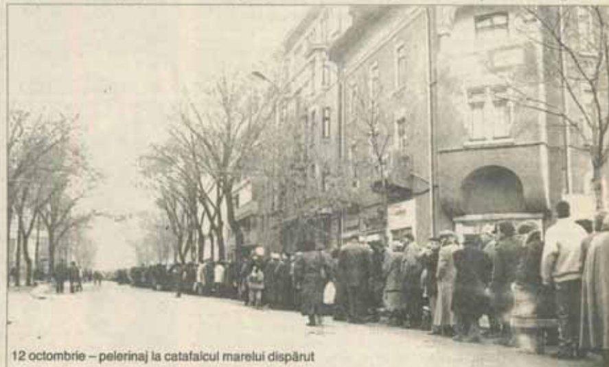
12 octombrie - pelerinaj la catafalcul marelui dispărut

4. Nu știu cum va evolua viața politică, și mai ales Convenția Democratică, fără Corneliu Coposu, pentru că noi, în Basarabia, cunoaștem viața politică românească din modestele comunicate de presă care ne mai soseesc din cînd în cînd. Cred că va trebui să treacă totuși un timp pînă cînd Opoziția își va reveni de pe urma acestei pierderi fără egal.